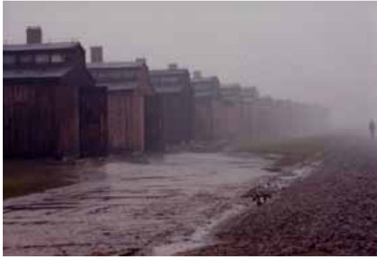
Grand prix Édition du concours 2009-2010 Dans le camp d'Auschwitz, Pologne Baccalauréat international