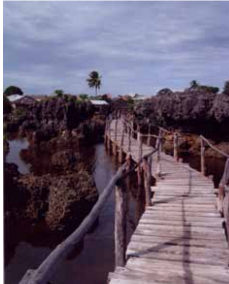
1 er prix catégorie photos de paysage ou touristique Édition du concours 2009-2010 Jardins de corail au Kenya Baccalauréat international