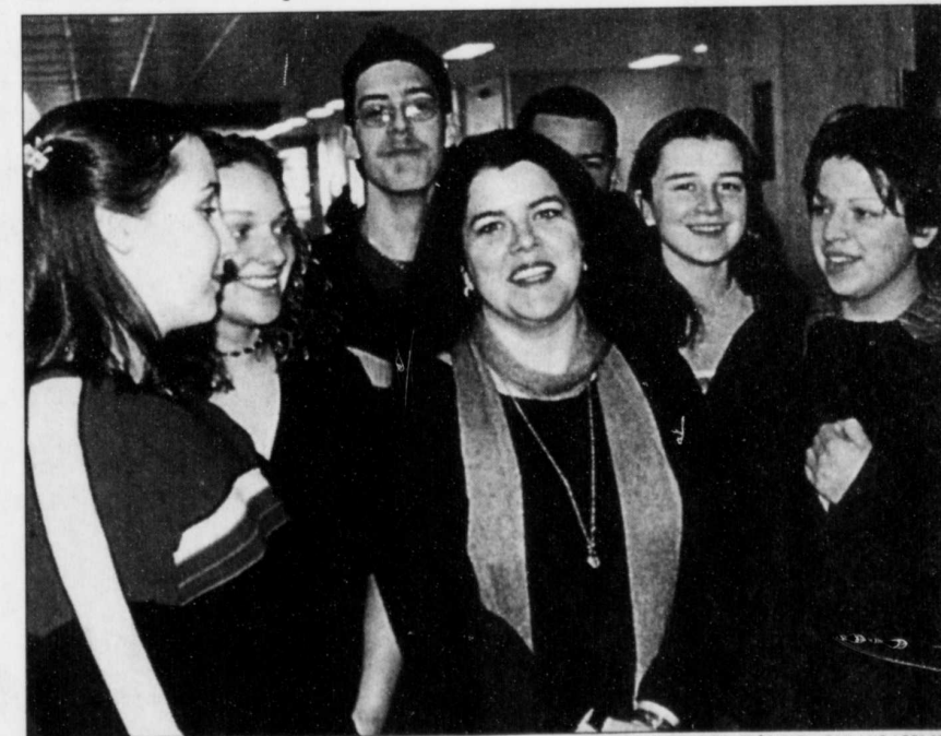
La romancière et présidente du jury pour le concours d'écriture et de dessin du SOLEIL, Chystine Brouillet, profite de sa présence au Salon du livre de la Côte-Nord pour rencontrer des étudiants. Elle cause ici avec des élèves de secondaire 4 et 5 de la polyvalente Manikoutai de Sept-Îles

ger l'image des adolescents qui sont habituellement reliés à la délinquance, aux arcades ou jeux vidéo. J'invite les jeunes à y participer parce que ça peut devenir un tremplin pour certains. J'aurais aimé que des concours semblables existent dans mon temps j'aurais sûrement écrit », lance celle qui a su dès l'âge de 12 ans qu'elle serait écrivaine.