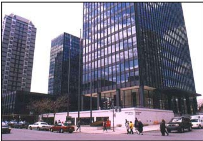
Westmount Square - Collège Dawson

Le campus du Collège Dawson de Montréal a été la scène d'une fusillade mortelle (2 morts et 19 blessés). On peut voir dans le geste du tireur fou une sorte de message fanatique et politique. Le tireur a déclaré sur son site