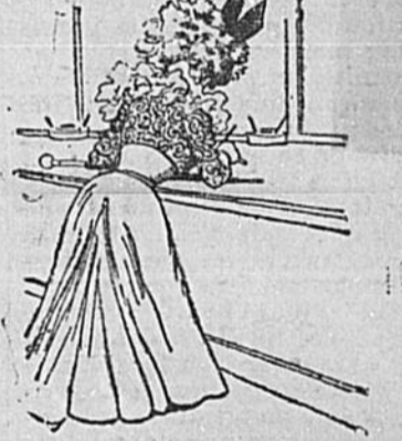
La jeune fille