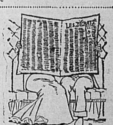
Le lendemain à la Bibliothèque de la rue Bleury.