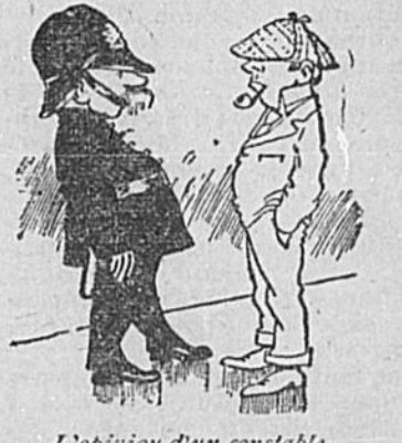
L'opinion d'un constable

—Vous perdez bien votre temps. Le Conseil n'en veut plus de censeurs.