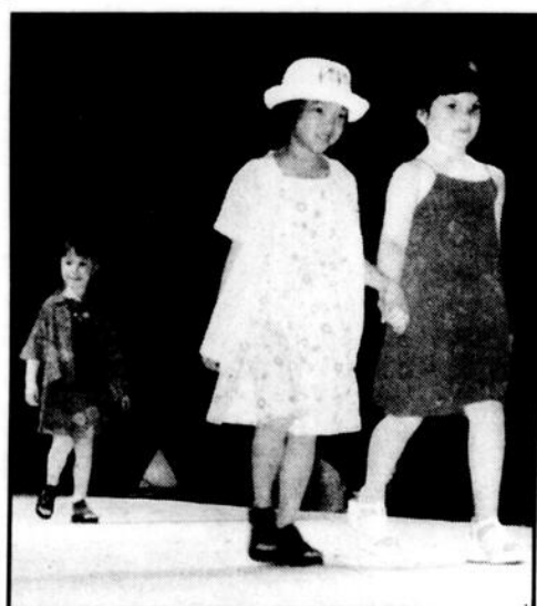
Des vêtements, il y en avait de tous les styles et de toutes les couleurs à l'occasion de ce défilé de mode.