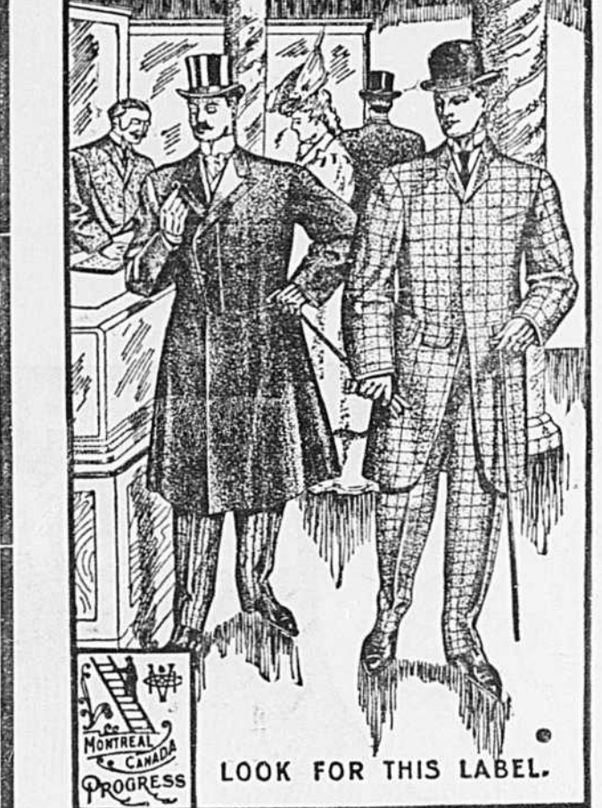
LOOK FOR THIS LABEL.

Les vêtements PROGRESS BRAND sont étiquetés pour de grosses commandes. On exige $2.00 de plus par habillement pour les commandes spéciales. C'est bien mieux ainsi que d'acheter au détail avec un semblant d'escompte. Les Vêtements PROGRESS BRAND vont à toutes les personnes qui ne sont pas difformes. Les Vêtements PROGRESS BRAND sont reconnus comme étant les meilleurs au Canada, et comme ils ne sont vendus que par les meilleurs marchands dans chaque ville, il n'y a pas à redouter une concurrence sérieuse. Quand un client, habillé d'un Vêtement PROGRESS revient chez vous, vous êtes content de le voir parce que vous le savez satisfait; il continuera d'acheter chez vous. Les Vêtements PROGRESS BRAND sont connus d'un océan à l'autre. Vous n'avez qu'à dire que c'est un "Progress" et la vente est faite. Les Vêtements PROGRESS BRAND satisfont vos clients qui vous amènent leurs amis. A moins qu'un autre marchand n'ait obtenu le privilège exclusif de la vente de Vêtements PROGRESS BRAND dans votre ville.