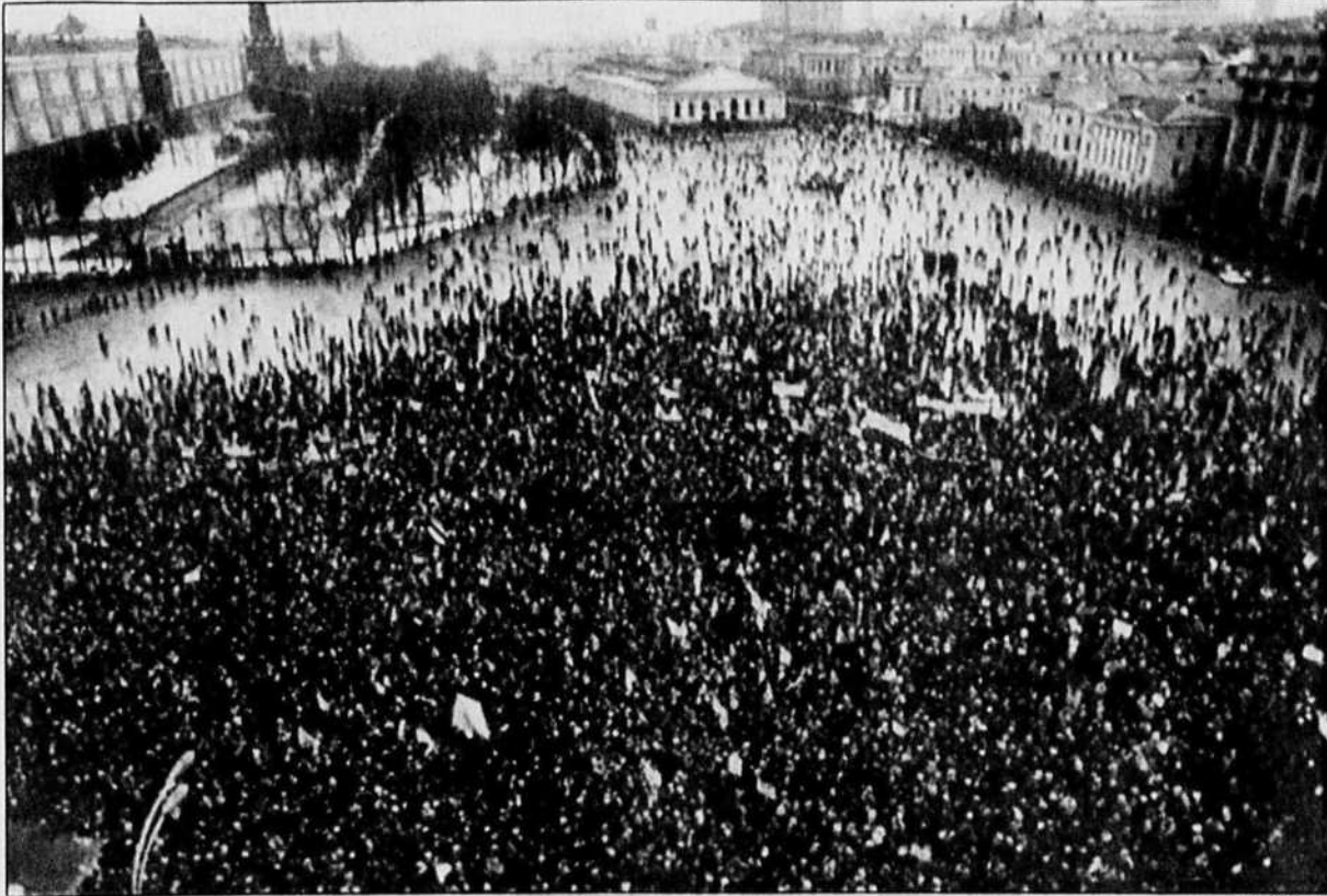
Des centaines de milliers de manifestants ont envahi les rues de Moscou, hier, aux abords du Kremlin pour appuyer Gorbatchev à la veille de sa confrontation avec le parti devant lequel il doit défendre ses réformes.

La police avait bouclé le boulevard de ceinture du centre-ville,