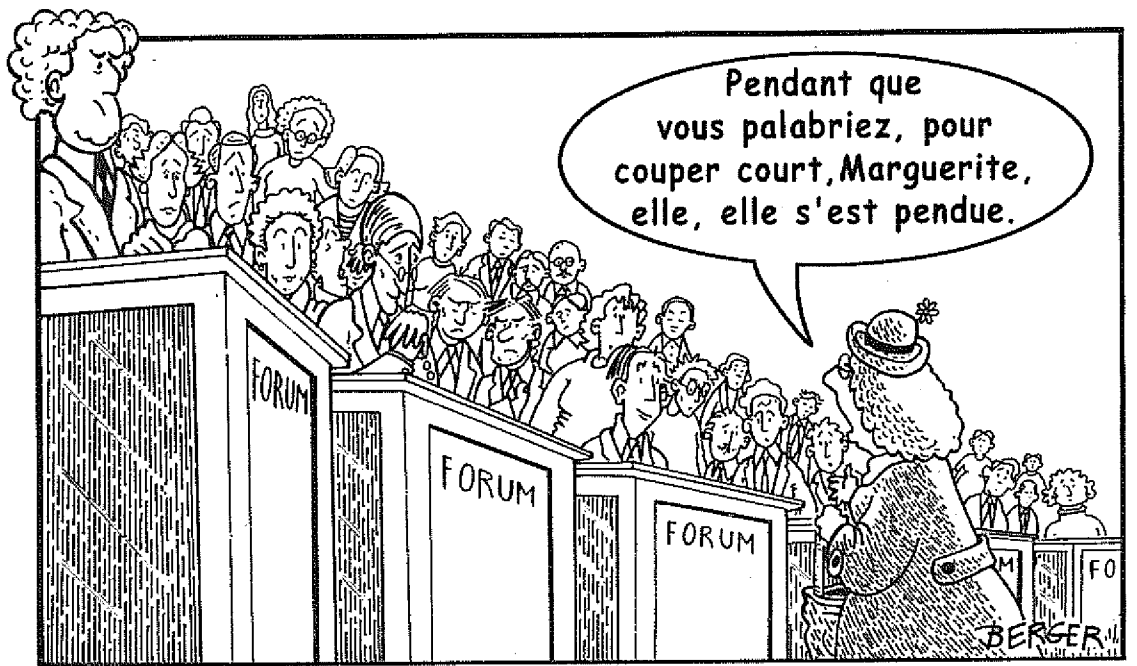
Caricature inspirée par un fait divers qui, autrement, serait passé inaperçu...