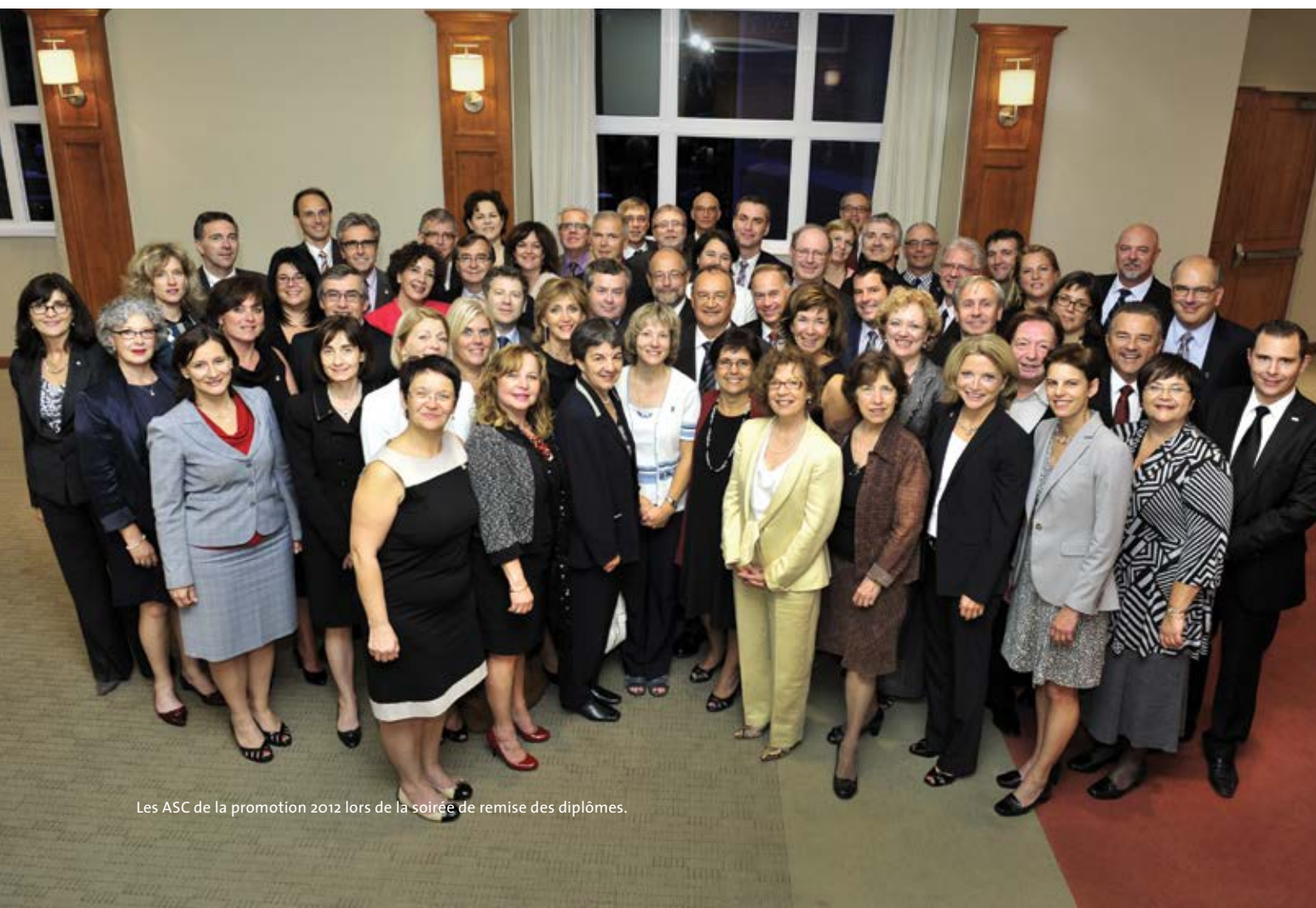
Les ASC de la promotion 2012 lors de la soirée de remise des diplômes.

Le contenu du programme est constamment mis à jour afin de répondre à l'évolution des tendances et des besoins spécifiques des administrateurs. Plus d'une soixantaine de formateurs – professeurs, praticiens et professionnels de renom – se mobilisent pour permettre aux participants de favoriser les meilleures pratiques de gouvernance. Le programme se divise en cinq modules de trois jours intensifs, dont quatre modules thématiques : Rôles et responsabilités des administrateurs – Stratégie et gestion des risques – Aspects financiers, contrôle et audit – Leadership, communications et ressources humaines et un axé sur la pratique : la simulation d'un conseil d'administration et de ses comités. Au total, les participants cumulent 120 heures de formation approfondie en classe, dont 20 heures de simulation.