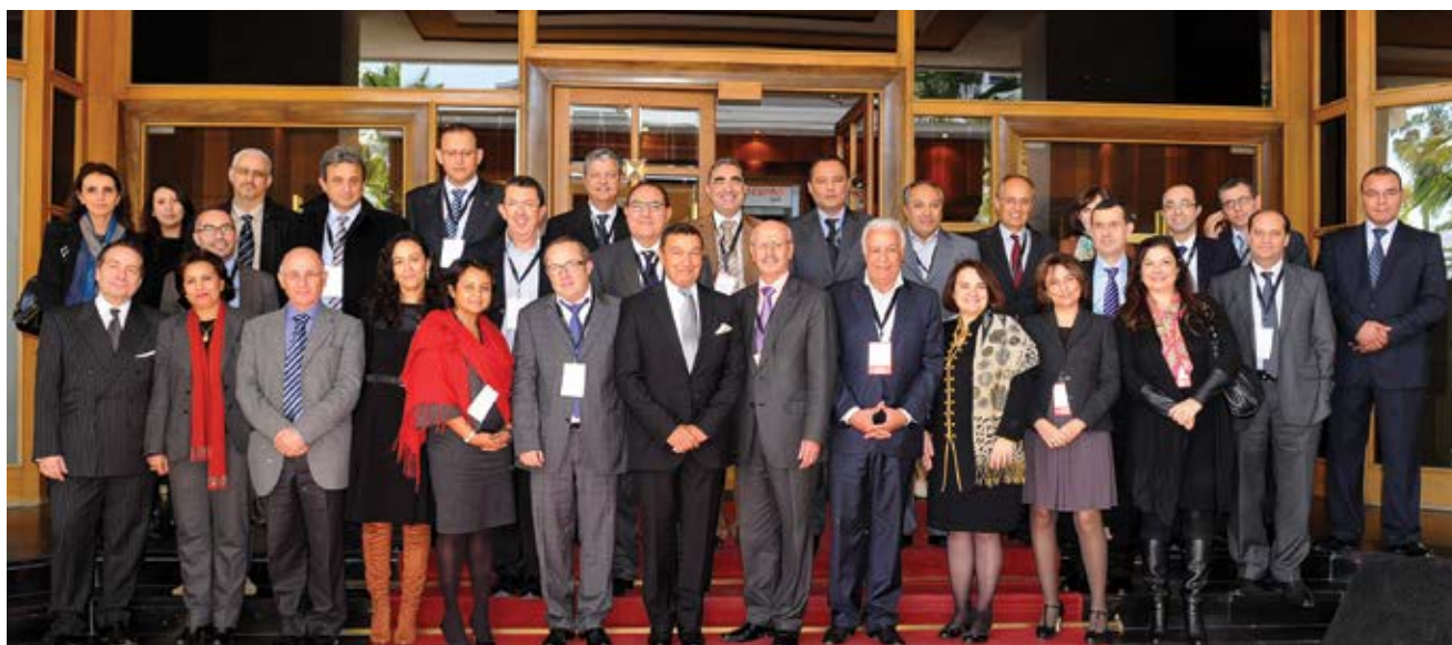
Les participants de la première cohorte marocaine et certains formateurs du programme de l'Institut marocain des administrateurs.