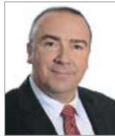
Bernard Généreux Impressions Soleil