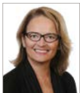
Anne Darche Pertinence inc.