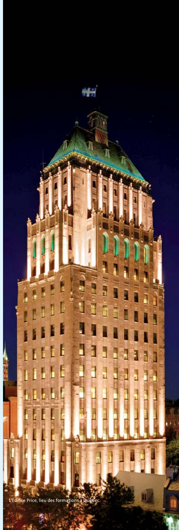
L'Édifice Price, lieu des formations à Québec.

Ce rapport d'activité couvre la période du 1 er juillet 2012 au 30 juin 2013.