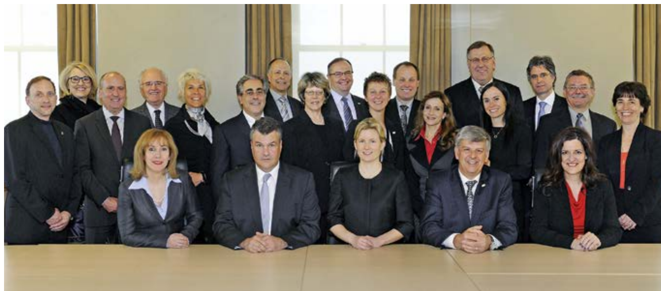
22 finissants de la cohorte d'avril 2013 à l'édifice Price, Québec.

Organisme du milieu associatif ou OBNL : 5 %