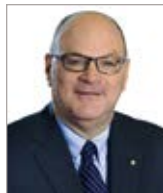
Rénard Turgeon Desjardins Assurances générales