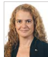
Julie Payette Centre des sciences de Montréal