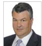
Pierre Rivard Rivard Fournier Avocats