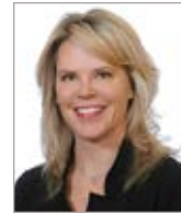
Nathalie Goodwin Agence Goodwin