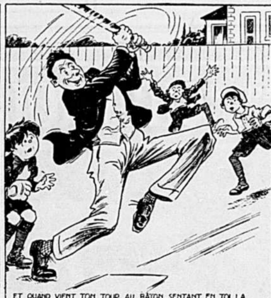
ET QUAND VIENT TON TOUR AU BÂTON, SENTANT EN TOI LA PUISSANCE DE BABE RUTH, TU PRENDS UN BEL ELAN—ET VLAN!