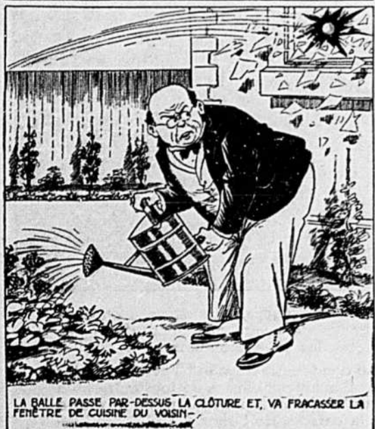
LA BALLE PASSE PAR-DESSUS LA CLÔTURE ET, VA FRAPPER LA FENÊTRE DE CUISINE DU VOISIN.