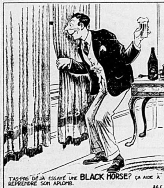
TAS-PAS DÉJÀ ESSAYÉ UNE BLACK HORSE? ÇA AIDE À REPRENDRE SON APLOMB.