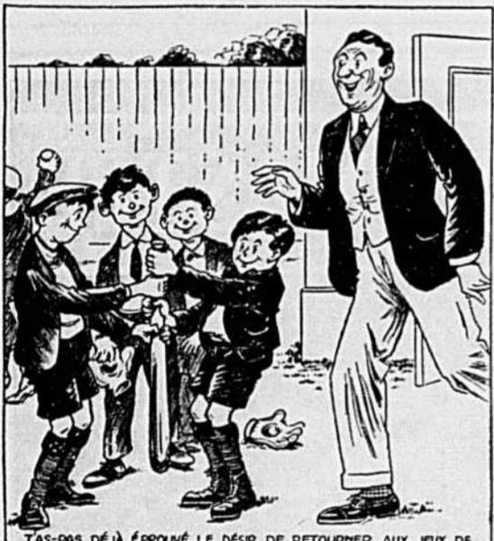
TAS-PAS DÉJÀ ÉPROUVÉ LE DÉSIR DE RETOURNER AUX JEUX DE TA JEUNESSE ET OFFERT AUX MARMOTS DU VOISINAGE DE JOUER UNE PARTIE DE BALLE AVEC EUX.