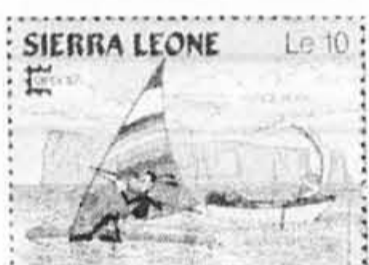
L'un des plus beaux timbres de cette série du Sierra Leone, fait voir le Rocher Percé, en Gaspésie.