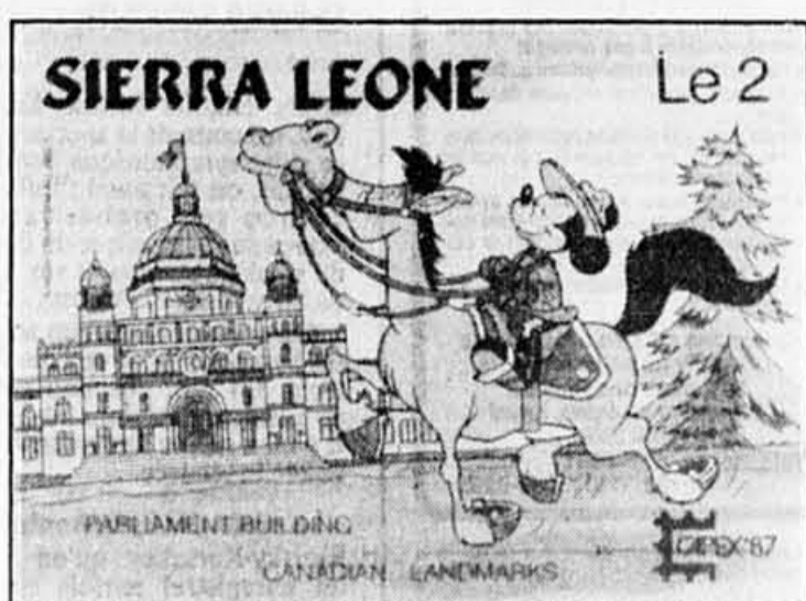
Les artistes des studios Walt Disney tentent de faire passer ce curieux bâtiment pour le Parlement d'Ottawa sur un timbre émis à l'occasion de CAPEX 87.