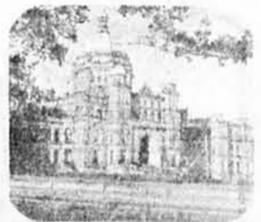
L'édifice parlementaire de Victoria.

De toute évidence, les artistes de la firme Walt Disney ont eu sous les yeux un immeuble parlementaire provincial qu'ils ont confondu avec celui de la nation, à Ottawa. Et la plupart des gens qui m'ont écrit pour me livrer leur opinion, ou de ceux qui m'en ont parlé, estiment qu'il s'agit de l'hôtel du Parlement de la Colombie-Britannique, à Victoria.