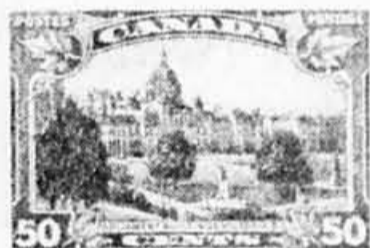
Un timbre canadien de 1935 donne une image éloignée du Parlement de Victoria.

Voilà donc l'histoire tragique que recèle l'image du Parlement de Victoria rendue par ce timbre de 1935.