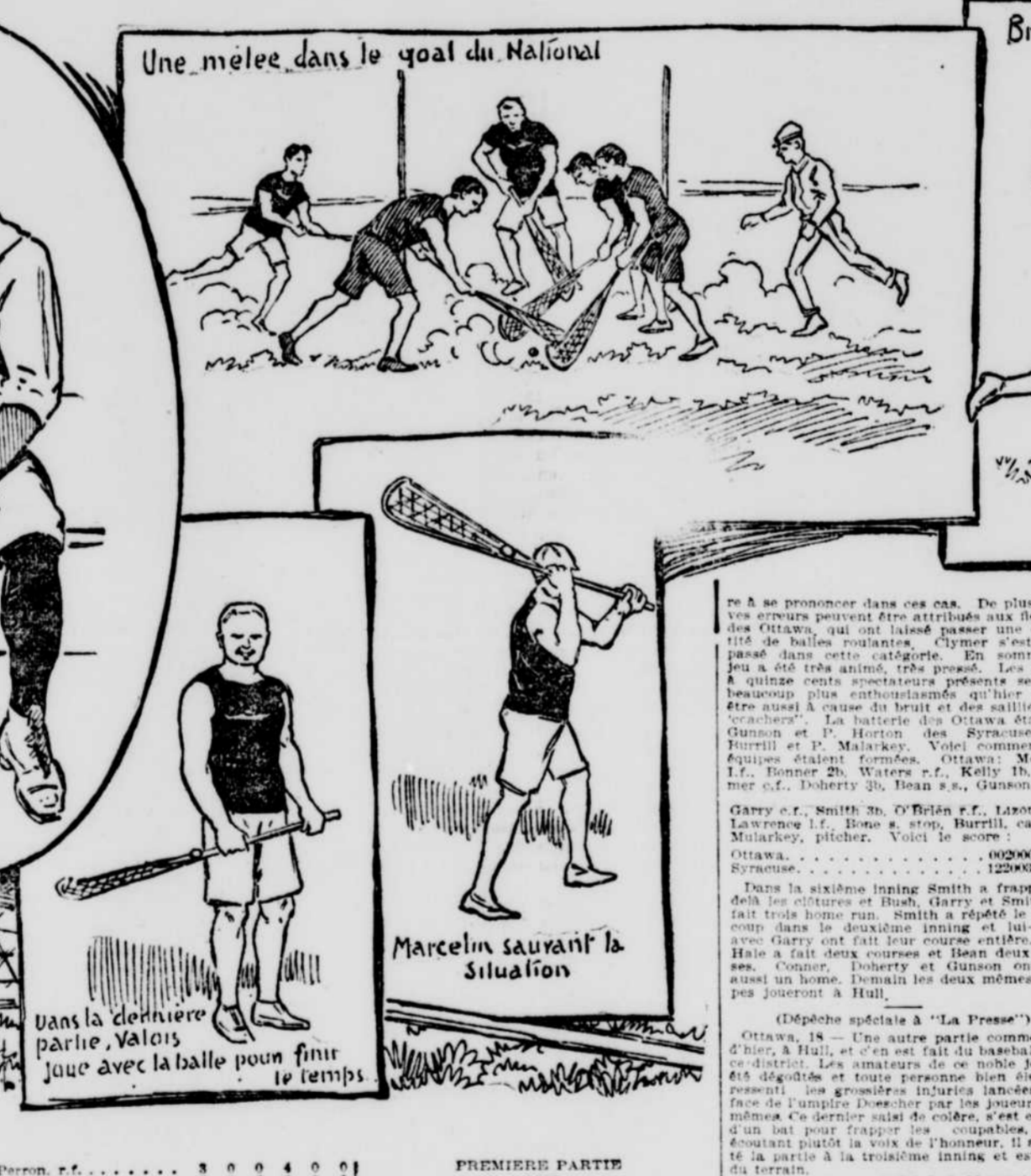
Une mêlée dans le goal du National