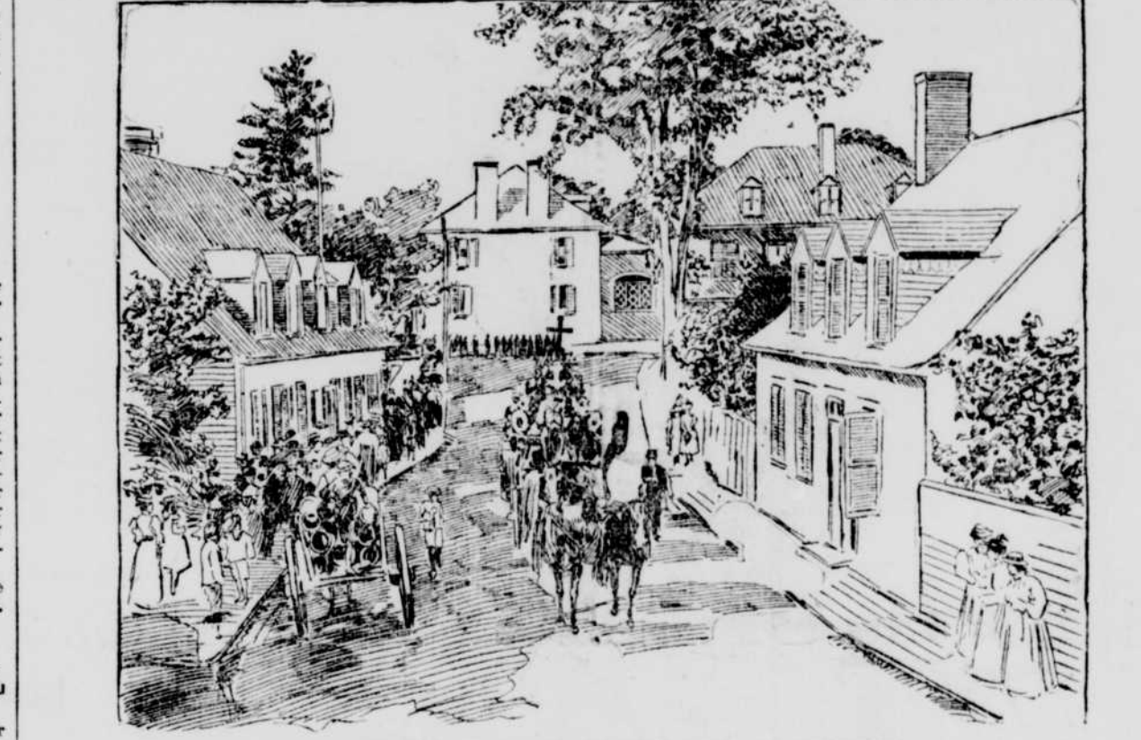
LA TRANSLATION DES RESTES DE MGR LAFLECHE

San Francisco, 18 — On apprend que le steamer "Concomough" a été perdu dans la mer de Behring, avec un autre steamer qu'il remorquait. Le tout était évalué à $40,000. Deux berges appar- tenant à l'Alaska Commercial Coy. sont perdues aussi. Elles valaient $20, 000. On dit qu'il y a très peu d'eau dans le Yukon, cette année.