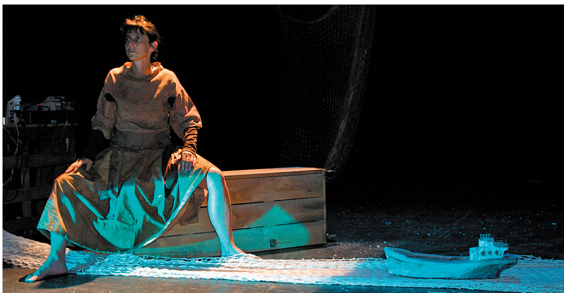
Cargo fait appel à «la poésie de l'image, des sons et des matières qui jouent le même rôle que les mots».