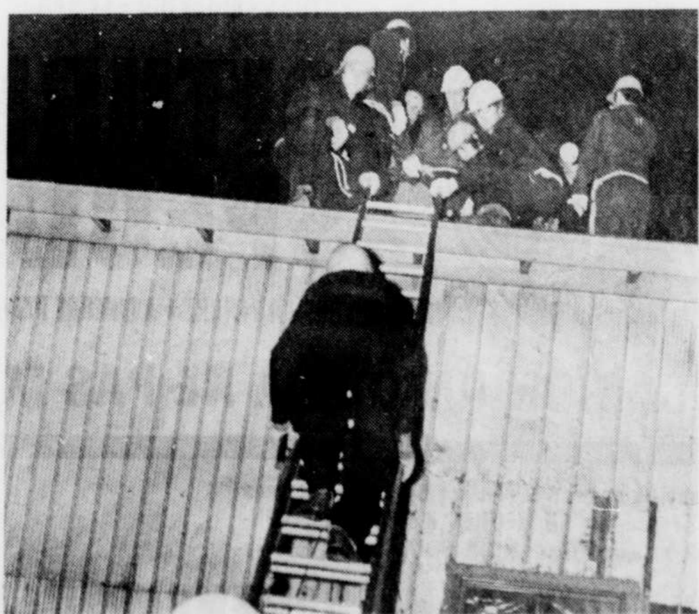
Après le premier blessé "sauvé" par des câbles, un autre homme fut "secouru" dans une échelle.

et à l'échange d'émissions avec d'autres villes. La seule exigence demandée fut la présentation de pièces justificatives.