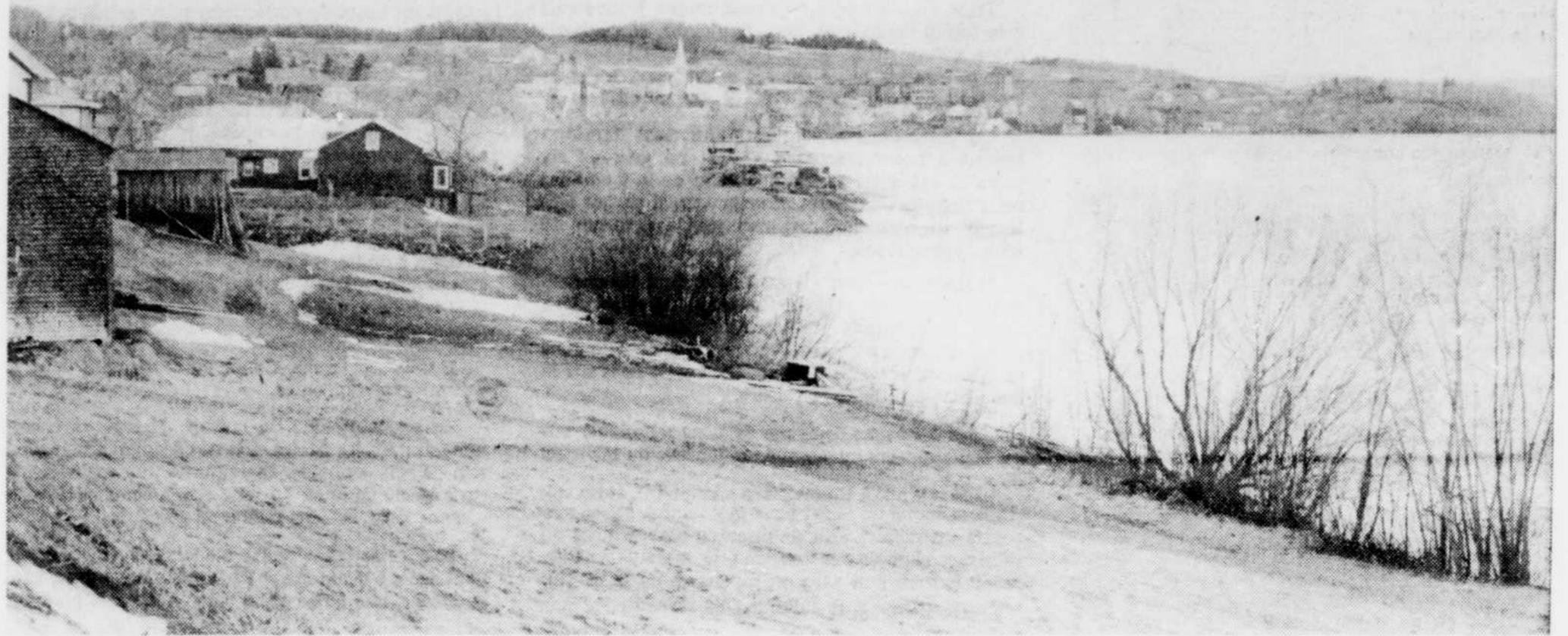
Selon les plans établis par le ministère de la Voirie, la route 49 passerait sur la rive Sud du lac Williams, soit entre le lac et la municipalité de St-Ferdinand. Les travaux doivent être effectués en 1975.

L'an dernier, la marche avait rapporté $14,692 soit moins que par les années précédentes. Malgré tout, les organisateurs de la marche 74 sont confiants de connaître une très bonne expérience cette année et comptent comme le dit un communiqué récemment émis par eux, sur la générosité et le réalisme de la population de la région de Thetford pour contribuer à la mesure de leurs moyens à réduire l'écart entre pays riches et pauvres.