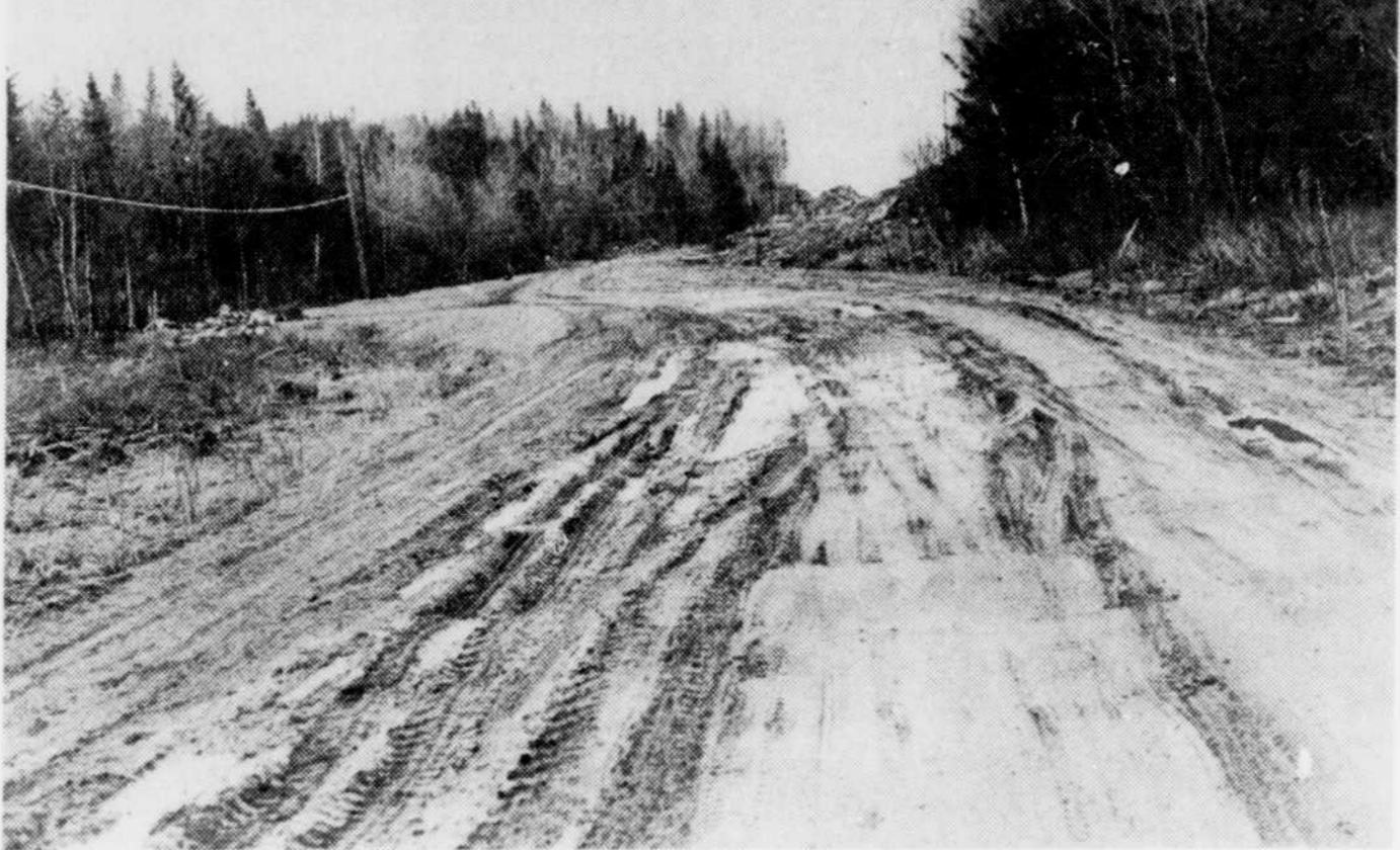
Une vue de la route entre Ste-Edwidge et Coaticook.