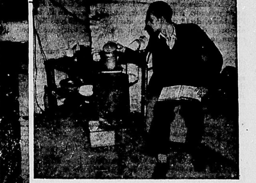
En attendant que l'Organisation internationale des réfugiés leur trouve des foyers, 2,000 réfugiés se sont inscrits dans les Universités d'Europe. A gauche, une bibliothèque a été installée dans la cave d'un bâtiment bombardé, à droite, un étudiant prépare son repas.