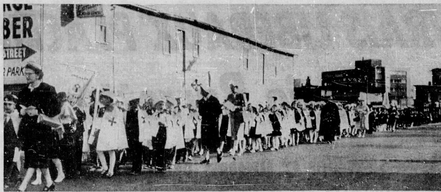
PROCESSION DE LA FÊTE-DIEU — Huit paroisses catholiques ont participé à la procession de la Fête-Dieu, dimanche soir dernier, organisée par les Ligues du Sacré-Coeur de la région. Les paroisses Ste-Anne, St-Eugène, St-Jean-de-Brébeuf, la Toussaint, l'Annonciation, St-Dominique, Garson et St. Mary's (Ukrainiens) ont pris part à cette manifestation de foi et d'amour de Dieu. C'était la première procession de la Fête-Dieu organisée depuis huit ans. La Ligue du Sacré-Coeur a l'intention d'organiser cette procession à tous les ans dorénavant.