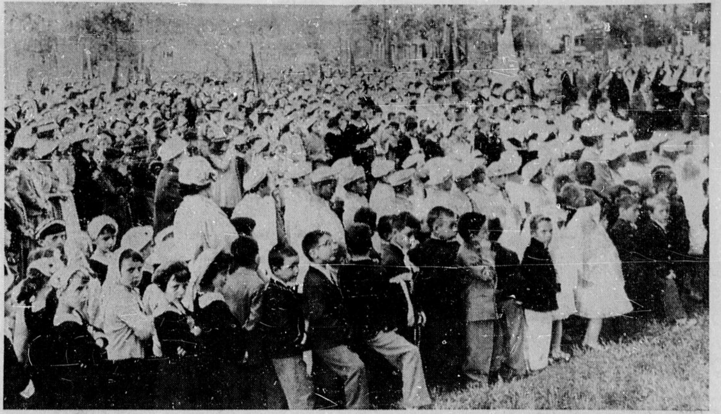
5.000 PERSONNES — Près de 5.000 personnes ont pris part à la procession de la Fête-Dieu organisée par les Ligues du Sacré-Coeur de la région. La procession a commencé à 7h, 30 de l'église Ste-Anne, pour les adultes et de l'école St-Louis-de-Gonzague pour les jeunes, et s'est terminée sur le terrain