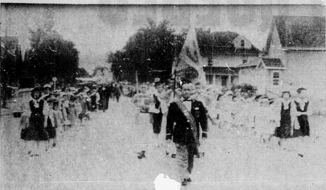
FETE-DIEU A STURGEON FALLS — Les fidèles de la paroisse de la Résurrection, à Sturgeon Falls, se sont rendus en grande