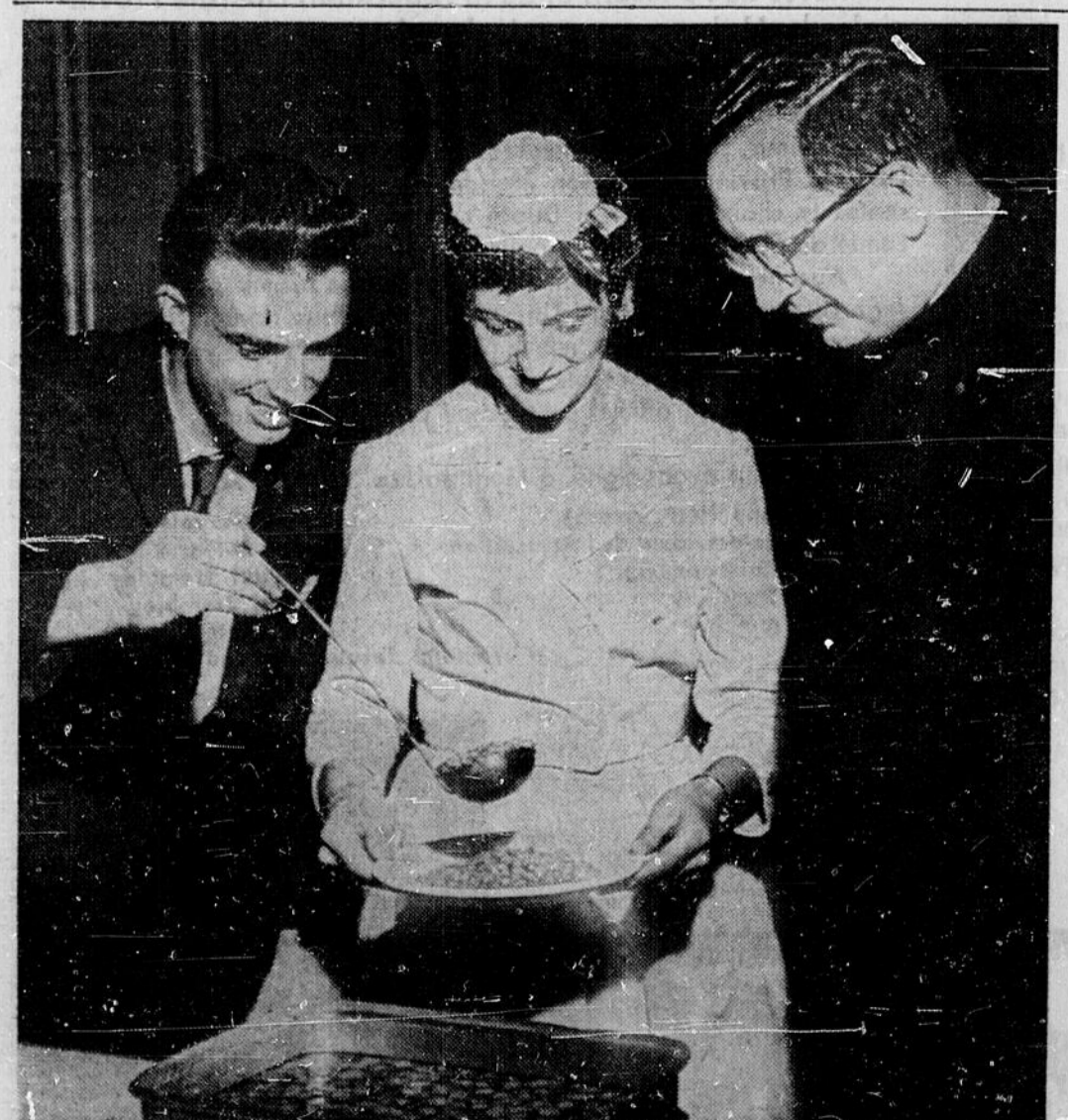
DINER AUX FEVES — Le conventum de la classe de rhétorique de 1949 se termina par le traditionnel dîner aux feves. Le dîner fut servi au réfectoire des élèves. Il y avait 24 élèves dans la classe de rhétorique de 1949, mais seulement 15 ont pu assister et prendre part à ce conventum. Plusieurs n'ont pu venir à cause des exigences de leur travail et quelques-uns étaient en dehors du

Le député de Hull regrette que le gouvernement ait gardé secret le rapport de la Commission du service civil qui recommandait des augmentations de salaires.