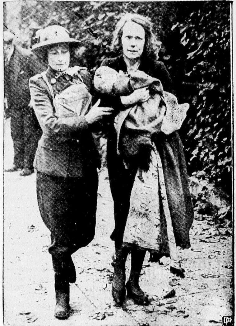
Des scènes comme celles-ci constituent ce que les Boches appellent "la guerre fraîche et joyeuse". Cette femme de Londres porte dans ses bras son bébé mort, tué raide, sans blessure apparente, par le choc d'une explosion. Hitler peut regarder le visage de cette femme sans émotion mais, quant à nous, cette scène doit nous faire penser sérieusement.