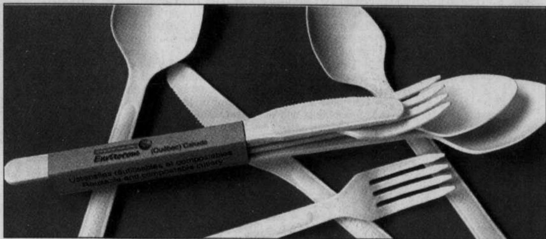
Des ustensiles compostables signés Nova Envirocom, une entreprise de Sherbrooke.