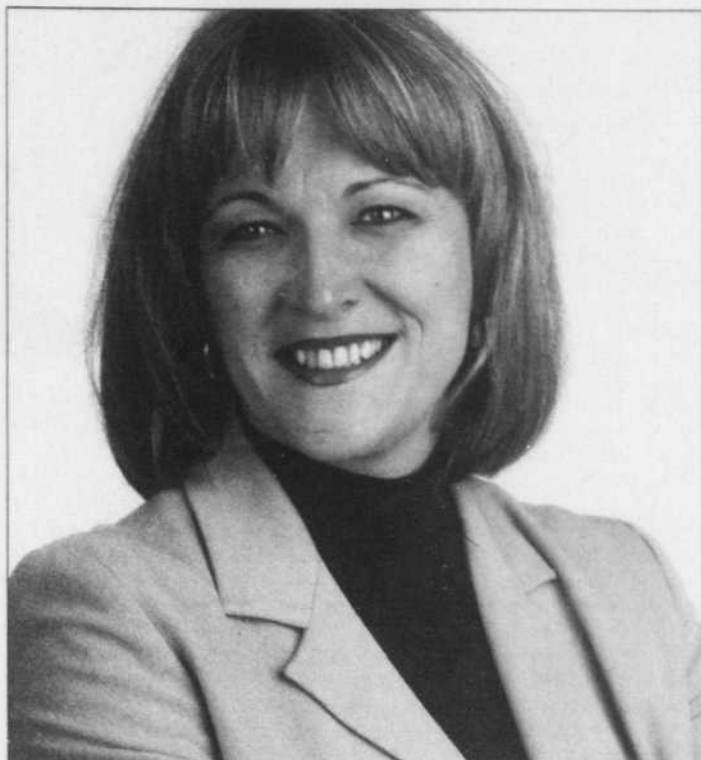
Lise Thériault, ministre de l'Immigration et des Communautés culturelles

Ces chiffres ne sont pas étrangers aux nouvelles mesures établies par le MICC, qui visent une