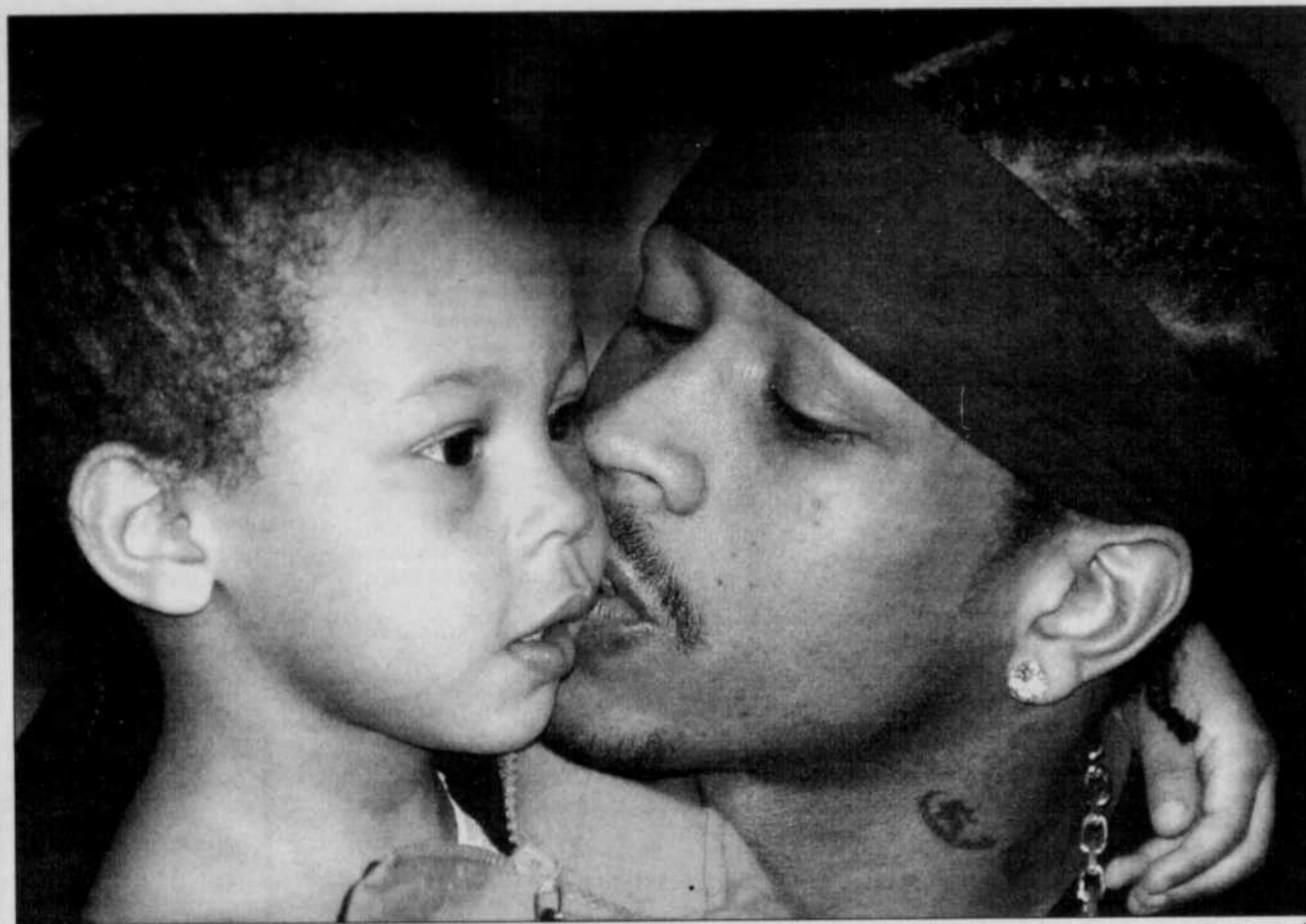
Allen Iverson reçoit une chaleureuse bise de la part du meilleur joueur de la NBA, son père.