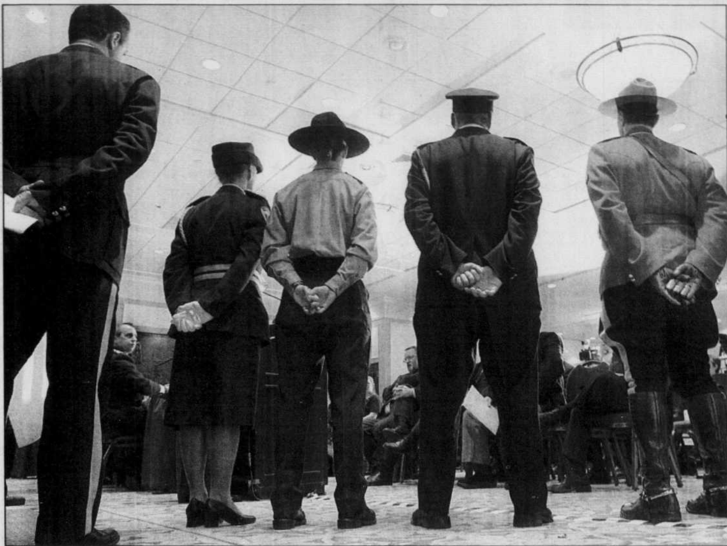
Trois services de police ont annoncé la mise sur pied du projet Amber au Québec.