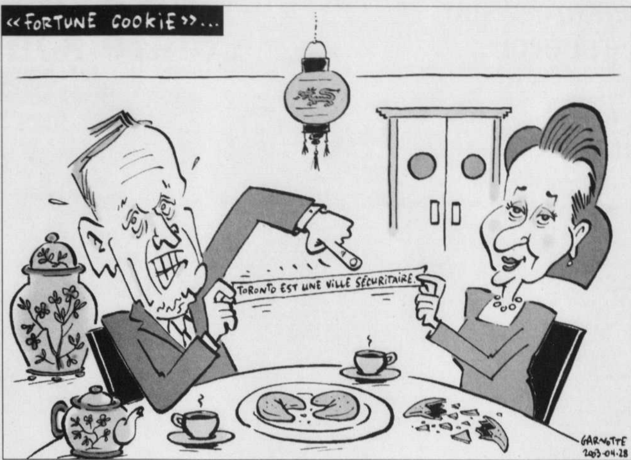
REPRISE DU 28 AVRIL 2003