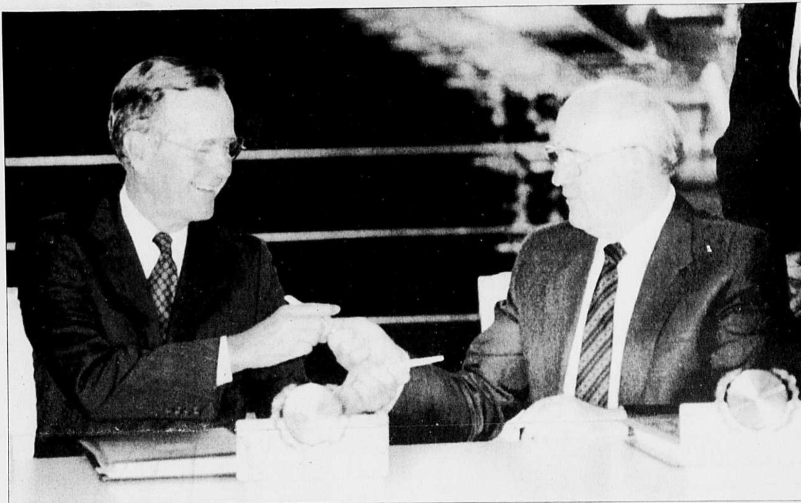
Pour en symboliser la portée, George Bush et Mikhaïl Gorbatchev ont signé le volumineux traité START avec des stylos taillés dans le métal de missiles détruits. La signature de ce traité de désarmement met fin à neuf ans de négociations.