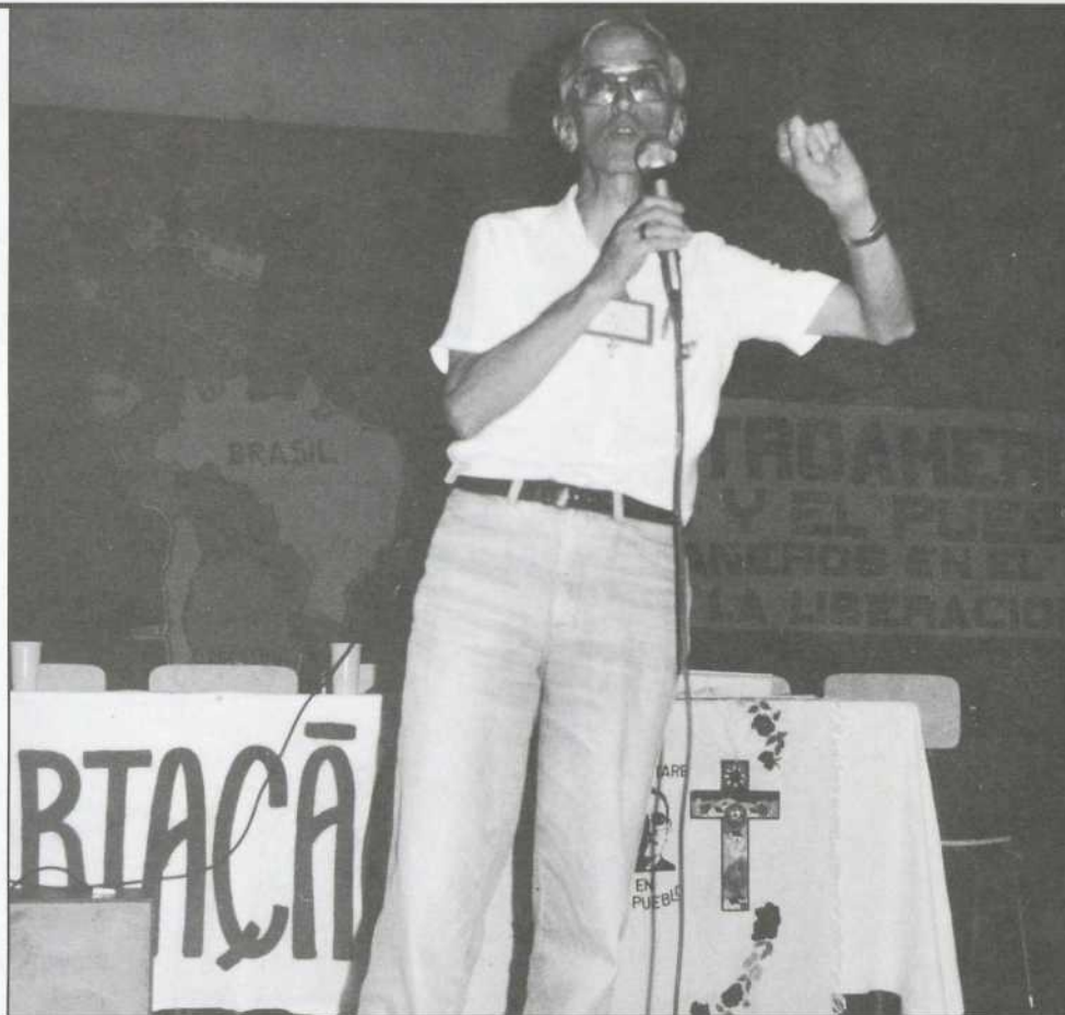
L'évêque Casaldaliga, ami des pauvres.