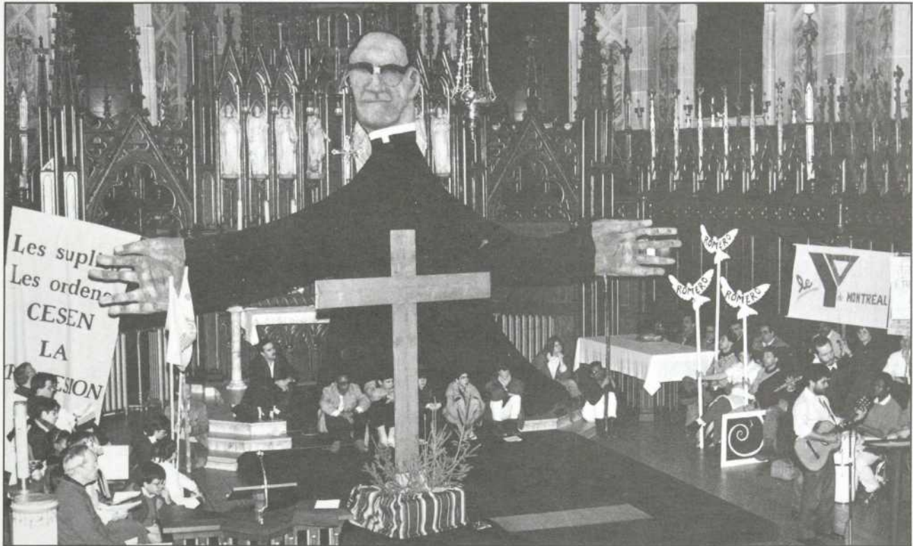
La Marche Mgr Romero : un événement chaque année, en solidarité avec les victimes des violations des droits humains.