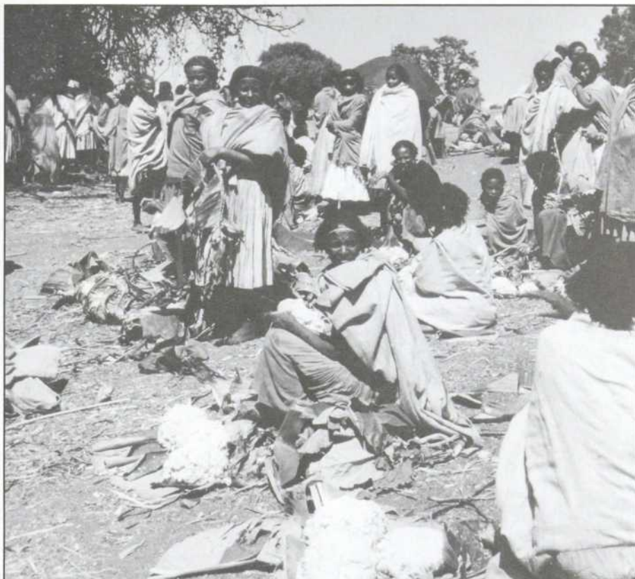
Comment faire des famines qui dépeuplent certaines parties de l'Afrique les éléments d'un plan providentiel ?

Pour beaucoup de chrétiens, la prière personnelle et l'abandon intérieur à Dieu sont devenus impossibles s'ils impliquent qu'on mette de côté les pauvres et les opprimés. Leur difficulté à prier n'est pas le résultat du sécularisme ; au contraire, leur solidarité avec les victimes de l'injustice répond à l'appel de Dieu, par Jésus, dans l'Esprit. La « crainte de la distorsion idéologique » et le « bris de confiance » ne naissent donc pas de ce que la Bible appelle « le monde », le souci exclusif du fini.