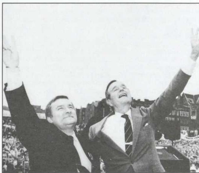
Le président Bush avec Lech Wałęsa, en Pologne : un appui prudent...

L'administration Bush a ouvertement admis ses craintes le 15 septembre dernier, par la voix du sous-secrétaire d'État aux Affaires étrangères, Lawrence Eagleburger. D'après M. Eagleburger, les États-Unis craignent que dans la foulée de la perestroïka à l'Est, l'Europe ne devienne instable, et l'avenir de l'alliance atlantique, incertain. Un monde multipolaire, a-t-il affirmé, ne sera pas nécessairement plus sûr qu'un monde dominé par la guerre froide, et les changements qui surviennent à l'Est pourraient bien provoquer trop de bouleversements pour être viables ( New York Times , 16 sept. 1989).