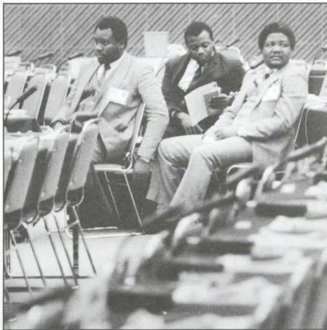
Les délégués du Zimbabwe. En agriculture, le libéralisme économique n'est pas une voie pour régler les problèmes des pays en voie de développement.

Il faut, certes, redonner des dents aux règles du GATT en matière agricole et en accroître la précision, mais non au prix, trop élevé, du libéralisme économique. ■