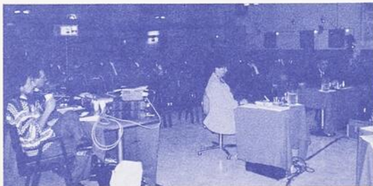
La deuxième partie de l'audience publique sur la liaison autoroutière entre Sainte-Luce et Mont-Joli tenue en janvier dernier à Mont-Joli. À gauche, l'équipe de sonorisation, au centre, la sténotypiste et à droite, l'auteur d'un mémoire.

Ce sont principalement des entreprises – commerces, industries ou services –, qui se sont