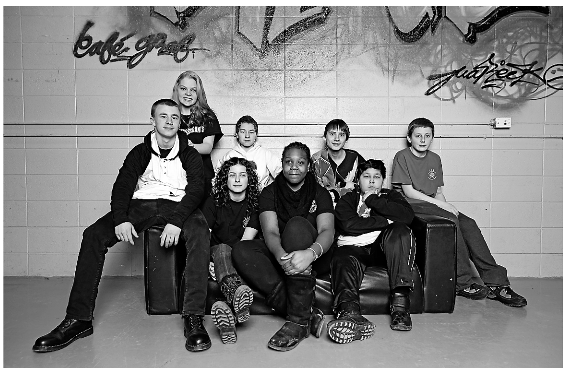
Avec l'aide de cinq experts, neuf élèves de l'école Cavalier-De LaSalle tentent de poursuivre leurs études dans l'émission Les persévérants .