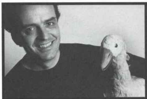
Véro Boncompagni ©