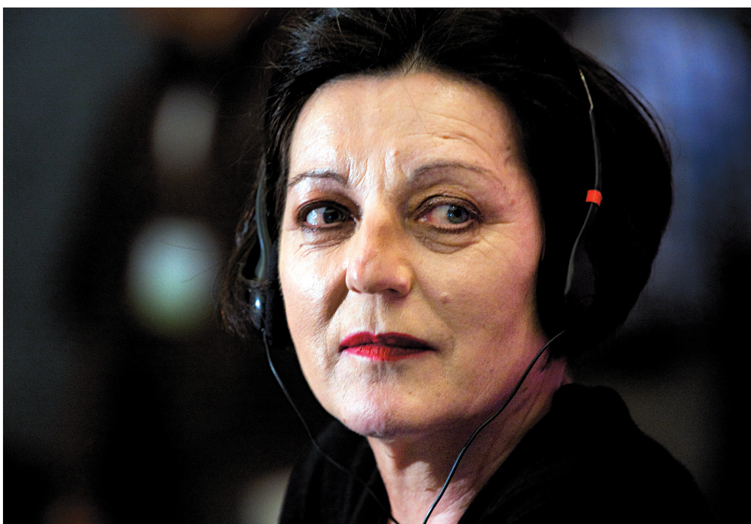
L'écrivaine allemande et Prix Nobel 2009 de littérature, Herta Müller, lors d'une conférence de presse à Guadalajara, au Mexique, en novembre dernier.

Le résultat, c'est une œuvre qui, inlassablement, dit la dictature au quotidien. La peur, le matin au réveil, de ne plus être là le soir au dîner. La peur de l'interrogatoire, des perquisitions. La peur de l'humiliation, du faux pas, des informateurs, de la solitude, de la folie, de l'exil... Née en 1953 dans le village germanophone de Nitzkydorf, en Roumanie, Herta Müller appartient à la