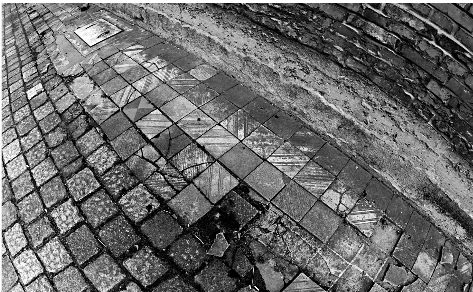
Georges Didi-Huberman cherche les mots qui disent le lien entre culture et barbarie. Au camp de la mort nazi de Birkenau, les traces sont au sol, et chacun peut y faire l'expérience de regarder «l'inimaginable», d'éprouver «l'inimaginable de la réalité passée».