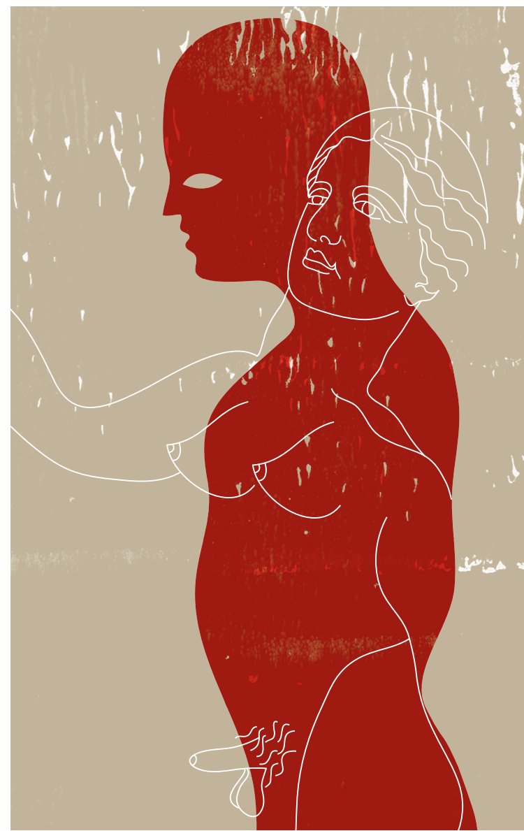
ILLUSTRATION CHRISTIAN TIFFET

ANNABEL Kathleen Winter (traduction Claudine Vivier) Boréal Montréal, 2012, 470 pages