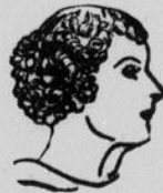
"Garanti de 6 mois"

QUE CE SOIT pour ondulations KOMOL, à l'eau, au papier ou traitement à la vapeur. Votre coiffure aidera votre charme.