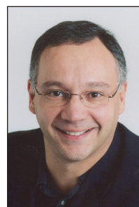
JOSEPH FACAL politologue et ancien ministre péquiste