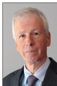
STÉPHANE DION député fédéral du Parti libéral du Canada