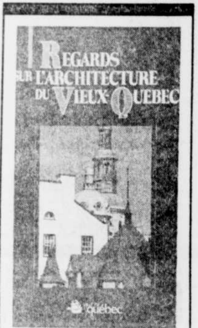
Volume sur l'architecture du Vieux-Québec