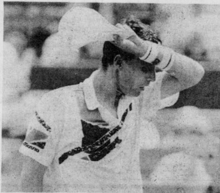
Ivan Lendl s'est buté à un Petr Korda en grande forme hier.