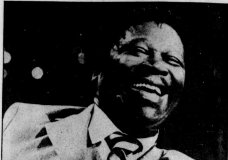
B.B. King a réalisé un rêve qu'il caressait depuis longtemps : s'entourer d'amis pour un tel enregistrement.

À souhaiter que le guitariste commette d'autres exercices de ce style.