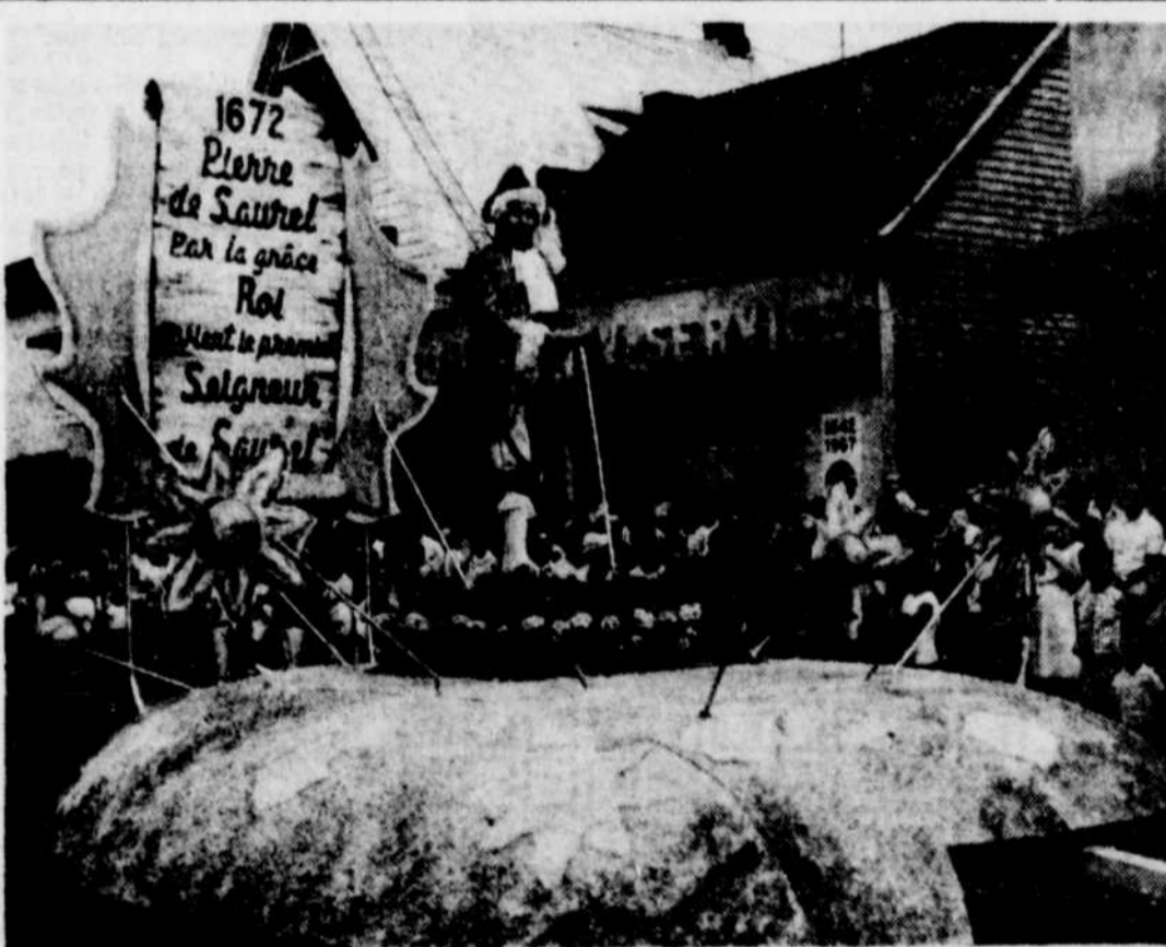
DES MILLIERS DE SORELOIS ont pu admirer dimanche après-midi ce char allégorique intitulé "Sorel, ville résidentielle", présenté par Sorel Finance et Administration, promoteur du Domaine Pierre de Saurel.