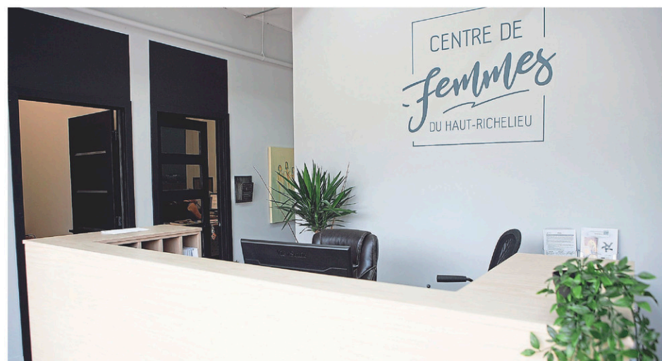
La 19 e journée nationale des centres de femmes aura lieu le 5 octobre. Jessyca Viens Gaboriau