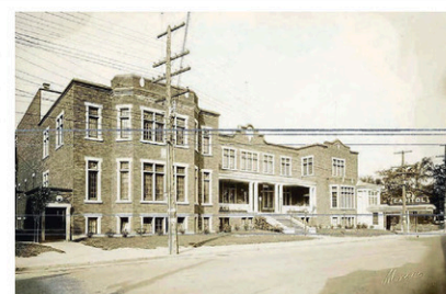
Édifice des Chevaliers de Colomb – Cinéma Capitol, vers 1930

La période des Années folles est capitale pour l'histoire du Québec. Elle se situe après une première guerre mondiale destructrice et meurtrière. Nombre de Canadiens sont mobilisés pour défendre la mère patrie, la Grande-Bretagne, au grand désarroi des Québécois qui ont voté contre la conscription obligatoire. Ces tensions entre francophones et anglophones au Canada continuent d'ailleurs à grandir durant les années 1920, entre autres au sujet de la prohibition.