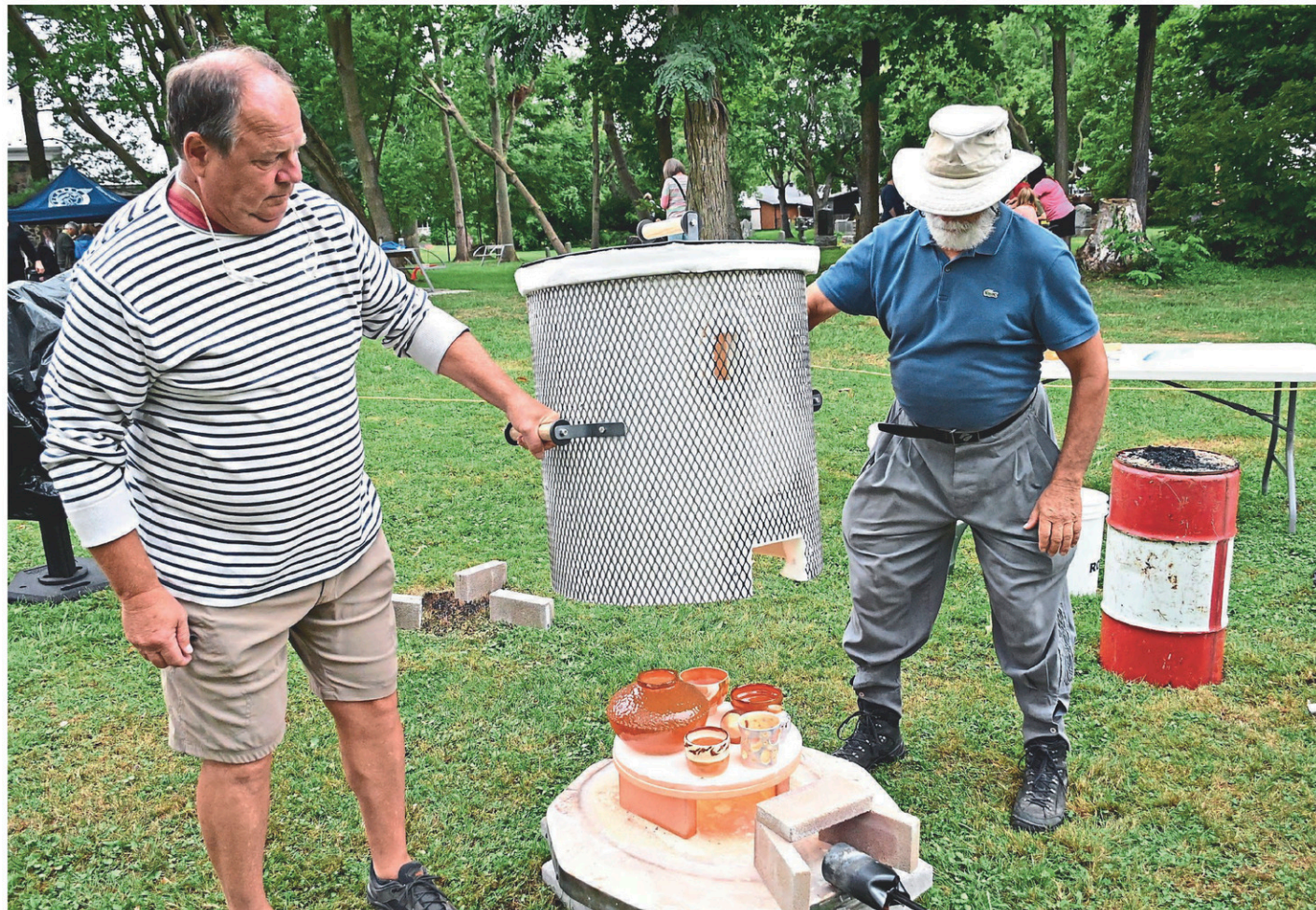
Les amateurs de poterie ont rendez-vous au Studio Terre à terre, sur la rue Saint-Paul, les 25 et 26 septembre.