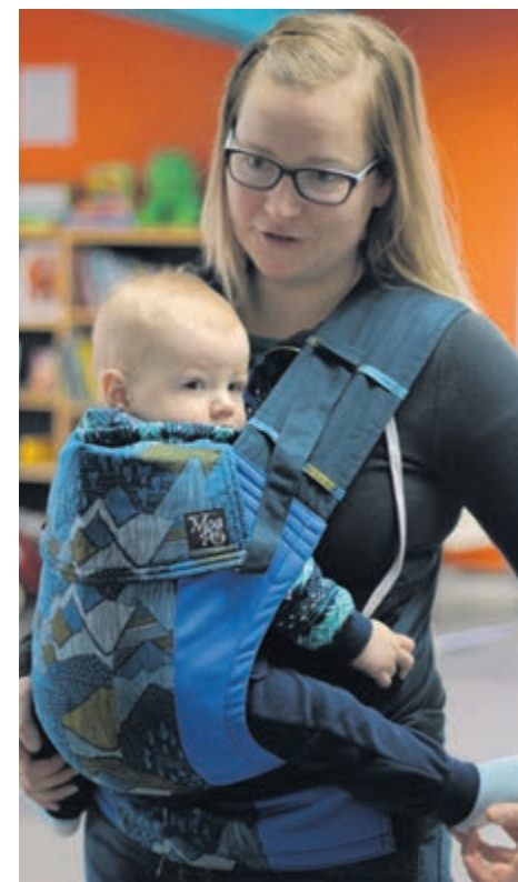
La Maison de la famille Avignon offre la possibilité d'emprunter gratuitement une écharpe de portage.

Depuis 2012, la Maison de la famille Avignon a pour mission d'offrir des activités et services visant à enrichir l'expérience parentale et favoriser le développement et le bien-être des enfants.