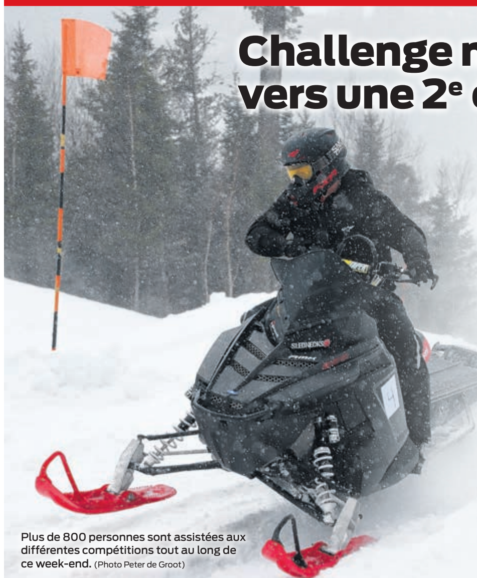
Plus de 800 personnes sont assistées aux différentes compétitions tout au long de ce week-end.

SPORT. Très fort succès pour la première édition du Challenge Motoneige Pin Rouge, les 7 et 8 avril, avec plus de 93 coureurs qui se sont affrontés lors des trois courses devant près de 800 spectateurs sur toute la fin de semaine.