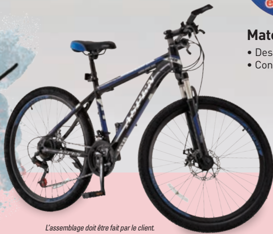
L'assemblage doit être fait par le client.

NOUS PAYONS LES 2 taxes 799 99 ou 15 99 50 mois