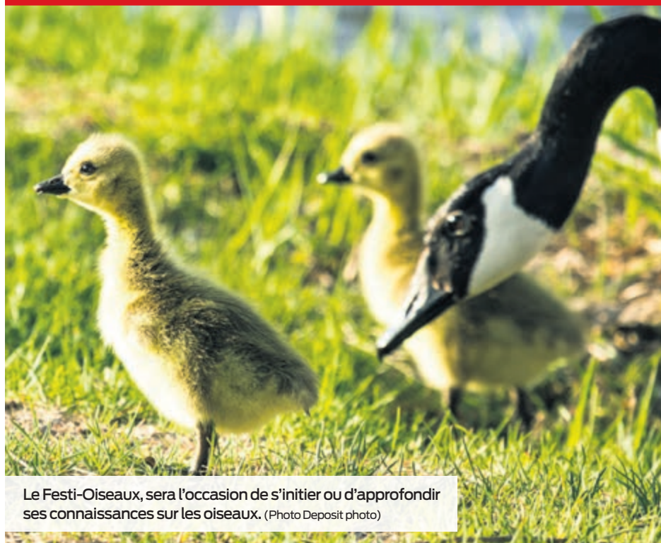
Le Festi-Oiseaux, sera l'occasion de s'initier ou d'approfondir ses connaissances sur les oiseaux.