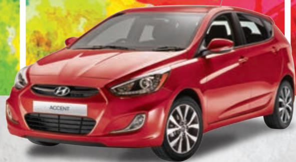
Modèle GLS auto montré*