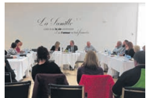
La dernière assemblée du conseil administratif du CISSS de la Gaspésie a eu lieu à la Villa Pabos de Chandler.