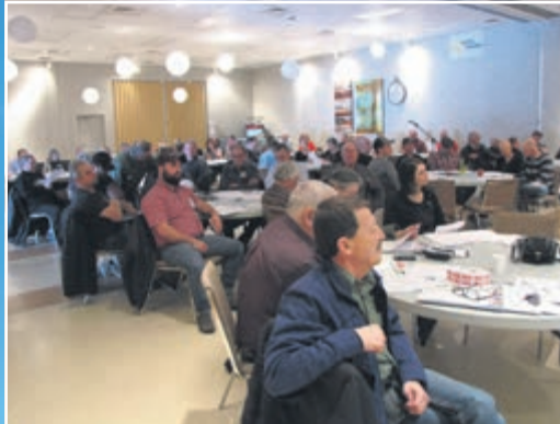
Assemblée générale (100 personnes)