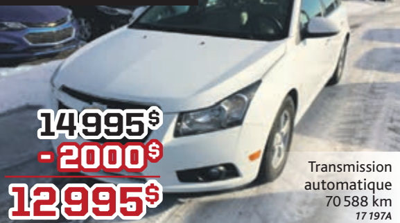
Chevrolet Cruze 2LT 2014