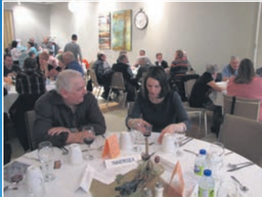
Salle du banquet (120 personnes)