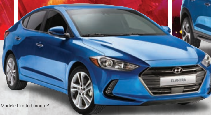
Modèle Limited montré*