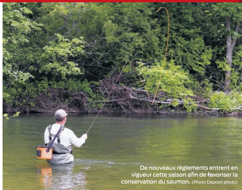
De nouveaux règlements entrent en vigueur cette saison afin de favoriser la conservation du saumon.