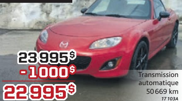
Mazda MX5 GS 2012