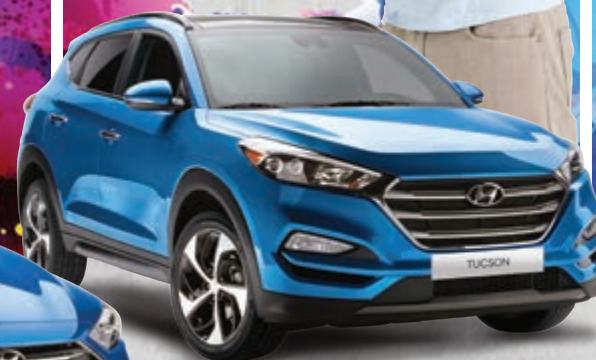
Modèle Ultimate montré*