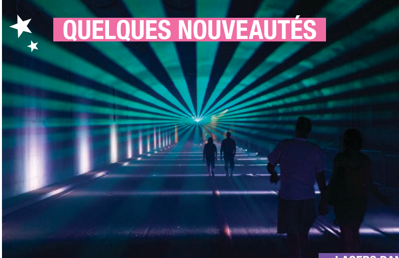
LASERS DANS LE TUNNEL