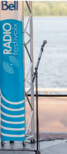
RADIO FESTIVOIX BELL