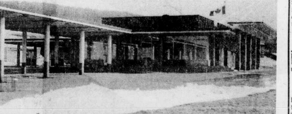
Les Villes frontalières, c'est la porte du Québec par le sud grâce à la route 143, l'autoroute 55, trois postes de douane, les services d'immigration, les coutiers et le poste de dédouanement. C'est ici qu'entre la majeure partie des touristes se dirigeant dans la partie centrale du Québec. Ici, c'est le poste de douane de l'autoroute 55.

soit à Coaticook, Lennoxville, Magog et Sherbrooke. Cet axe a éliminé peut-être sans le vouloir les petites régions comme le secteur des Villes frontalières. Cette situation se retrouve égale-