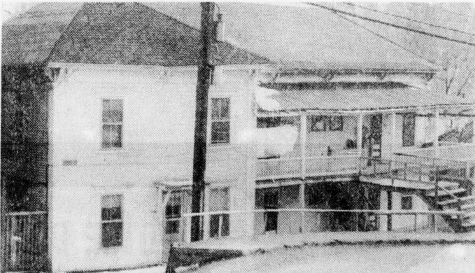
Il y a encore des habitations comprenant de nombreux loyers mais aux Villes frontalières il n'y a pas de projet concret pour aménager un foyer ou des habitations à loyer modique...

Et pourtant, il est assez difficile d'obtenir rapidement un bon loyer qui serait libre immédiatement.