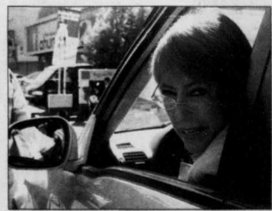
La favorite à l'élection présidentielle chilienne, la socialiste Michelle Bachelet, au volant de sa voiture, hier, à Santiago.