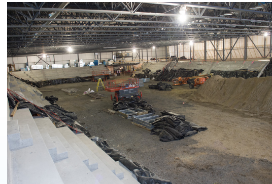
Une vue de la patinoire de 1000 places. La mezzanine qui comprendra un restaurant se trouve à la droite. Elle sera vitrée et séparera les deux glaces.