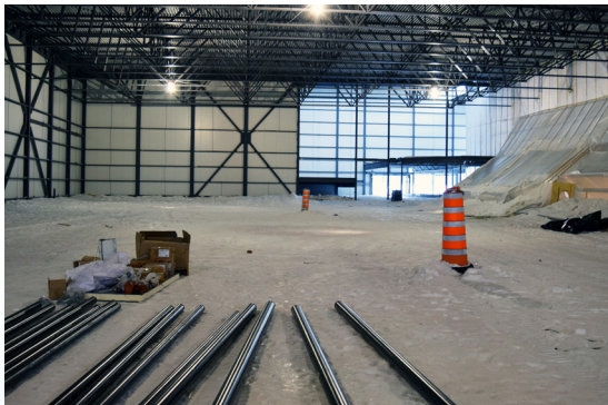
Glace numéro 2 (300 places assises).

Des représentants des villes de Sainte-Sophie, Prévost et Saint-Jérôme ont constaté l'avancement du chantier lors d'une visite le 18 février dernier.