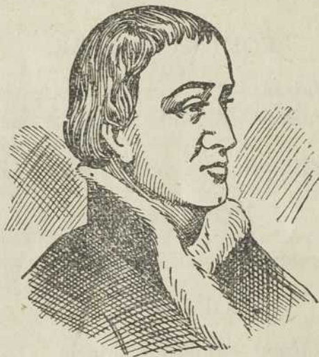
CHOMÉDY DE MAISONNEUVE

L'année suivante, il jeta les fondements de la ville de Montréal dont il fut le premier gouverneur. Cette ville fut d'abord nommée Ville-Marie.