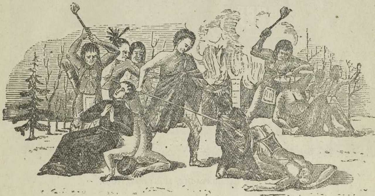
MORT DU PÈRE GARNIER

Outre l'influence religieuse que la fondation de Montréal exerça sur les sauvages, elle assura les communications avec la nation huronne et les autres peuples de l'ouest. M. de Maisonneuve et ses compagnons vivaient les armes à la main. Les Iroquois rôdaient autour de Ville-Marie comme des bêtes fauves.