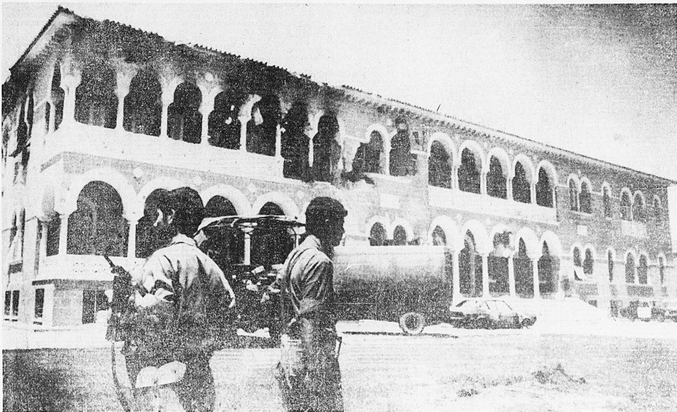
Des soldats de la garde nationale patrouillaient hier autour de l'Archevêché de Nicosie qui fut partiellement détruit lors du coup d'Etat qui a renversé lundi dernier le président Makarios. Cette nuit, la fusillade et les bombardements ont repris à Nicosie.

NICOSIE (AFP-Reuter-UPI) — Les troupes armées turques sont débarquées cette nuit à Chypre. Les premiers débarquements de soldats, équipés de tanks et appuyés par l'aviation, ont eu lieu vers trois heures GMT sur la côte nord de l'île, près de Kyrenia.