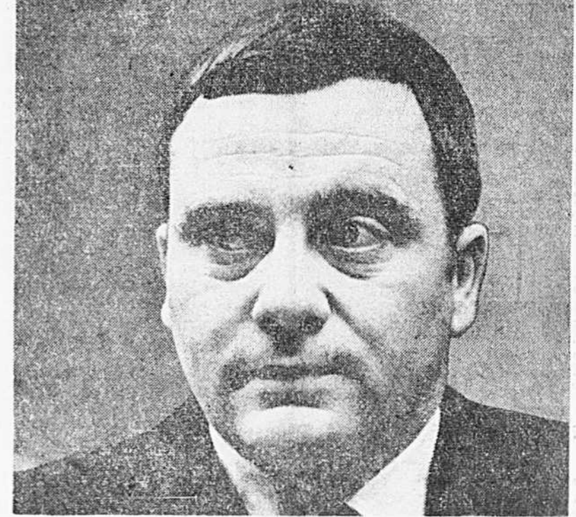
Le commissaire Cyrille Delage a fait des recommandations conformément à la loi qui régit sa fonction.