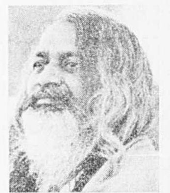
Maharishi Mahesh Yogi

Un état de conscience majeur: un eveil intérieur accompagné d'un repos profond