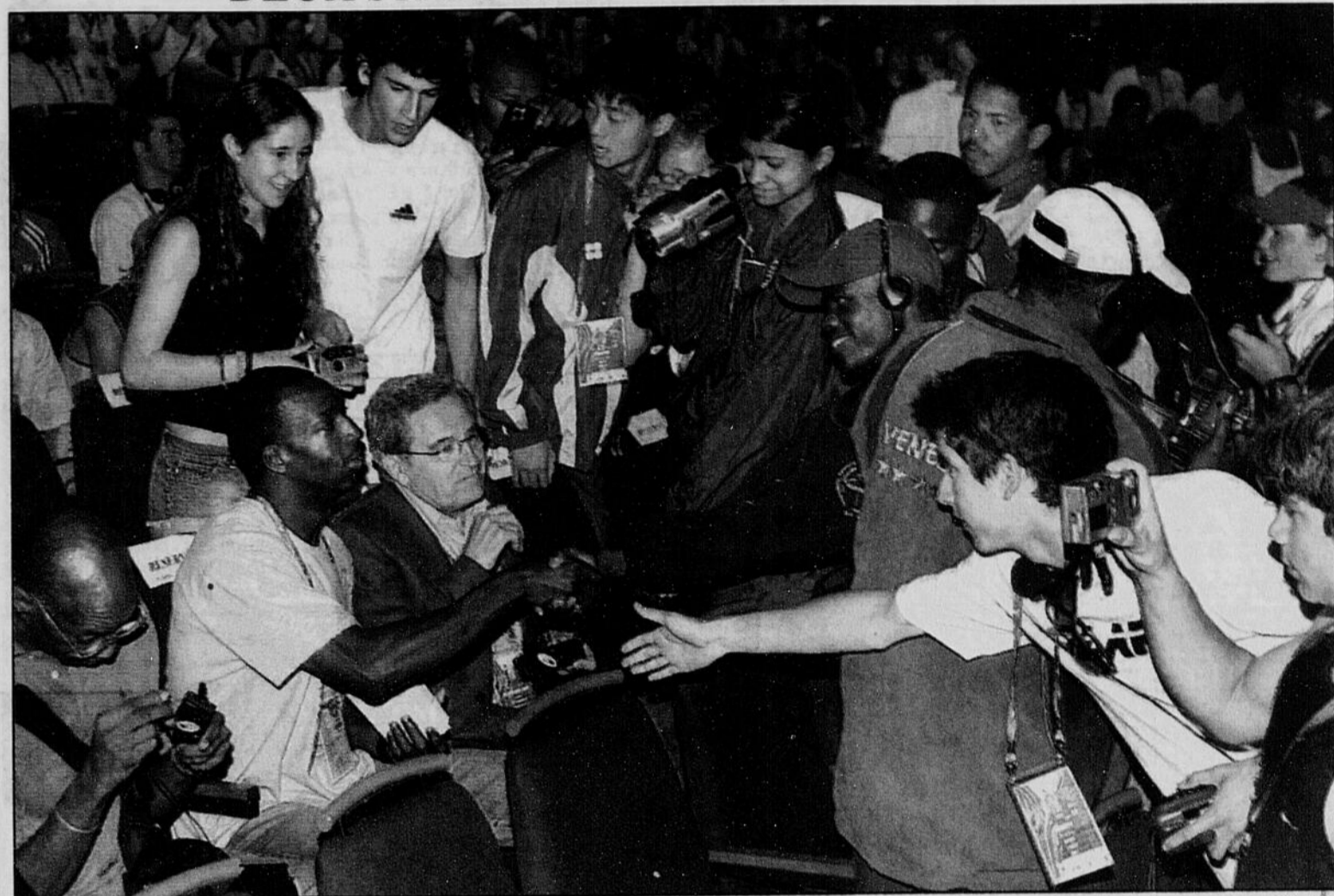
Imacom, Vincent Cotnoir

L'athlète américain Michael Johnson, qui a dominé la scène mondiale sur les distances de 200 et 400 mètres dans les années 90, a signé des autographes et serré plusieurs mains, hier à la salle Maurice O'Bready, lors d'une causerie en compagnie des athlètes qui s'apprêtent à participer aux 3es championnats du monde d'athlétisme jeunesse.