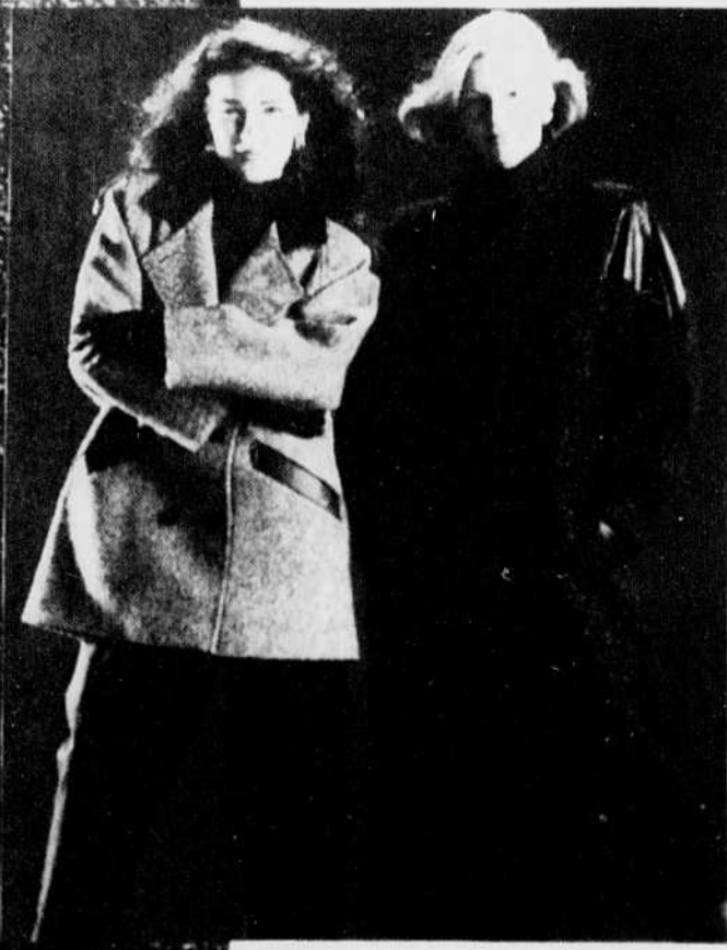
MAGASINAGE EN PERSONNE

Prix en vigueur jusqu'au 15 octobre 1988, ou jusqu'à épuisement des stocks.