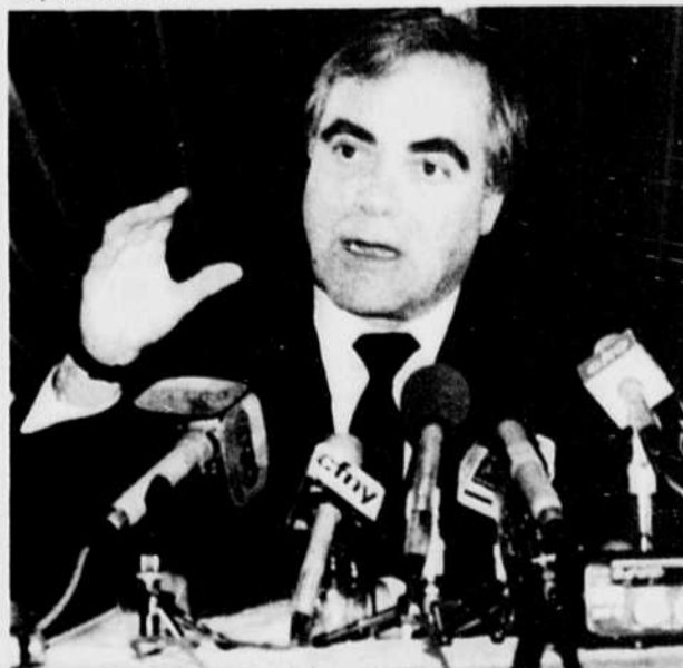
M. Marcel Masse, ministre fédéral de l'Énergie, des Mines et des Ressources

3.— Pourquoi, Monsieur le ministre, est-ce qu'un gouvernement qui vante les mérites de la libre entreprise et du respect des forces du marché se croit-il obligé de soutenir financièrement EAEL à raison de quatre cents millions de dollars en moyenne par année, alors que cette société de la Couronne fédérale n'a pas vendu un seul réacteur depuis dix ans?