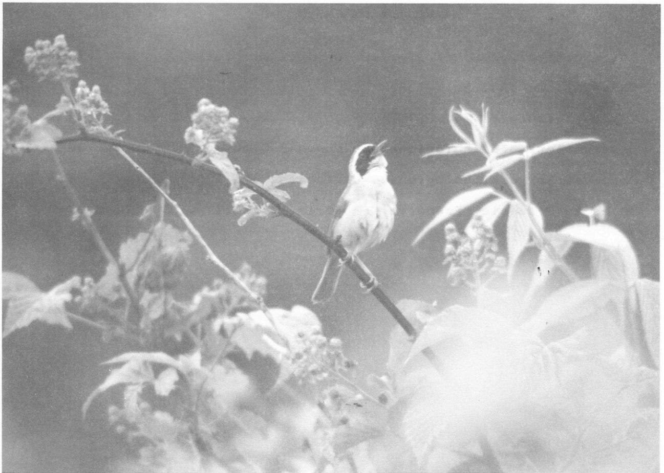
Paruline masquée