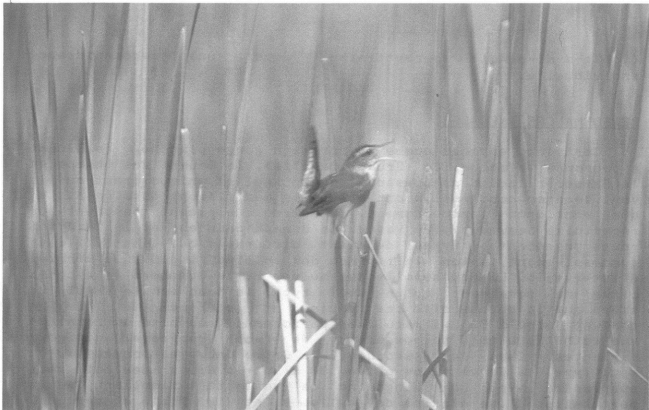
Trogodyte des marais