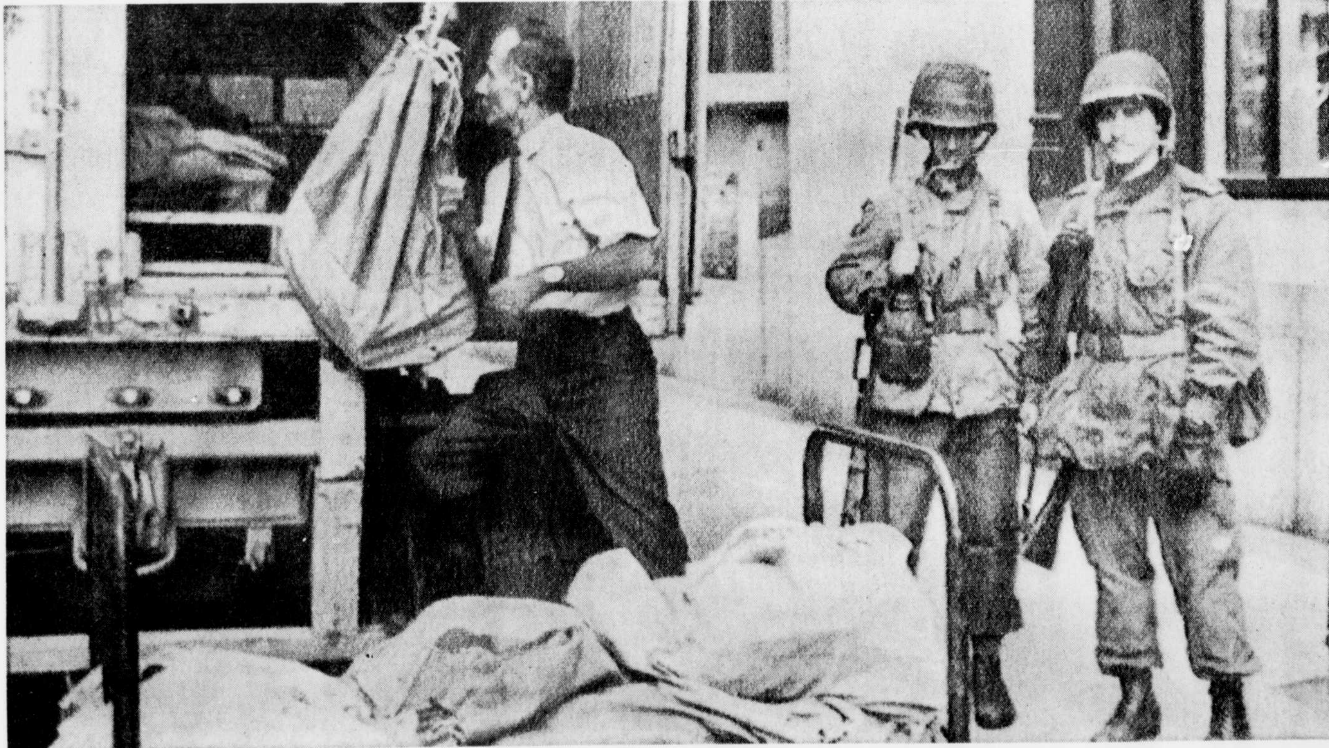
Le Québec sous la protection de l'armée

A 2h.45 a.m. le corps est identifié par des membres de la famille.