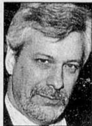
Pierre Marc Johnson

québécois, il faut, dans le processus de passage des connaissances aux produits, viser une viabilité qui s'appuie surtout sur un marché d'exportation. De la même façon qu'Hydro-Québec amène des technologies, qui lui ont coûté cher à développer, on s'attendra donc à ce que l'apport des partenaires comprenne une contribution substantielle, notamment une capacité de pénétrer les marchés qui sont le plus souvent des marchés d'exportation.»