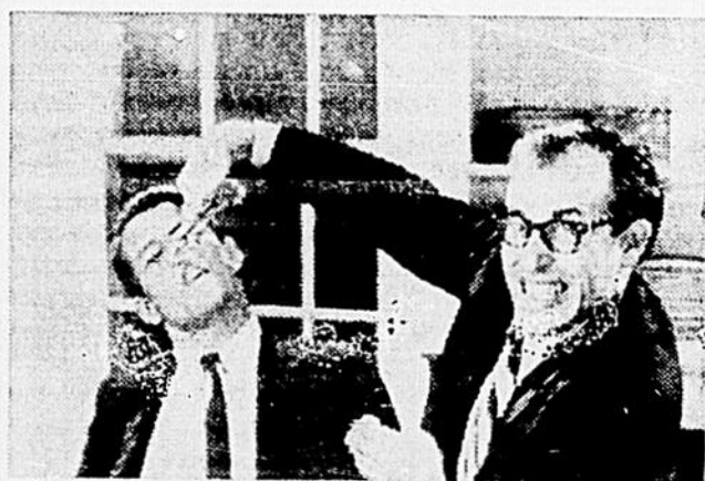
un film d'ADOLFAS MEKAS