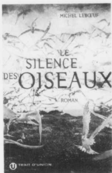
LE SILENCE DES OISEAUX, un thriller scientifique de Michel Leboeuf.

Les chercheurs s'allieront dans une enquête qui ouvrira plusieurs pistes troublantes. Mais la rivalité, l'individualis-