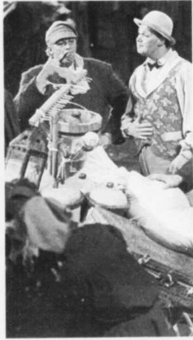
LA FABULEUSE... histoire d'un royaume à La Baie.