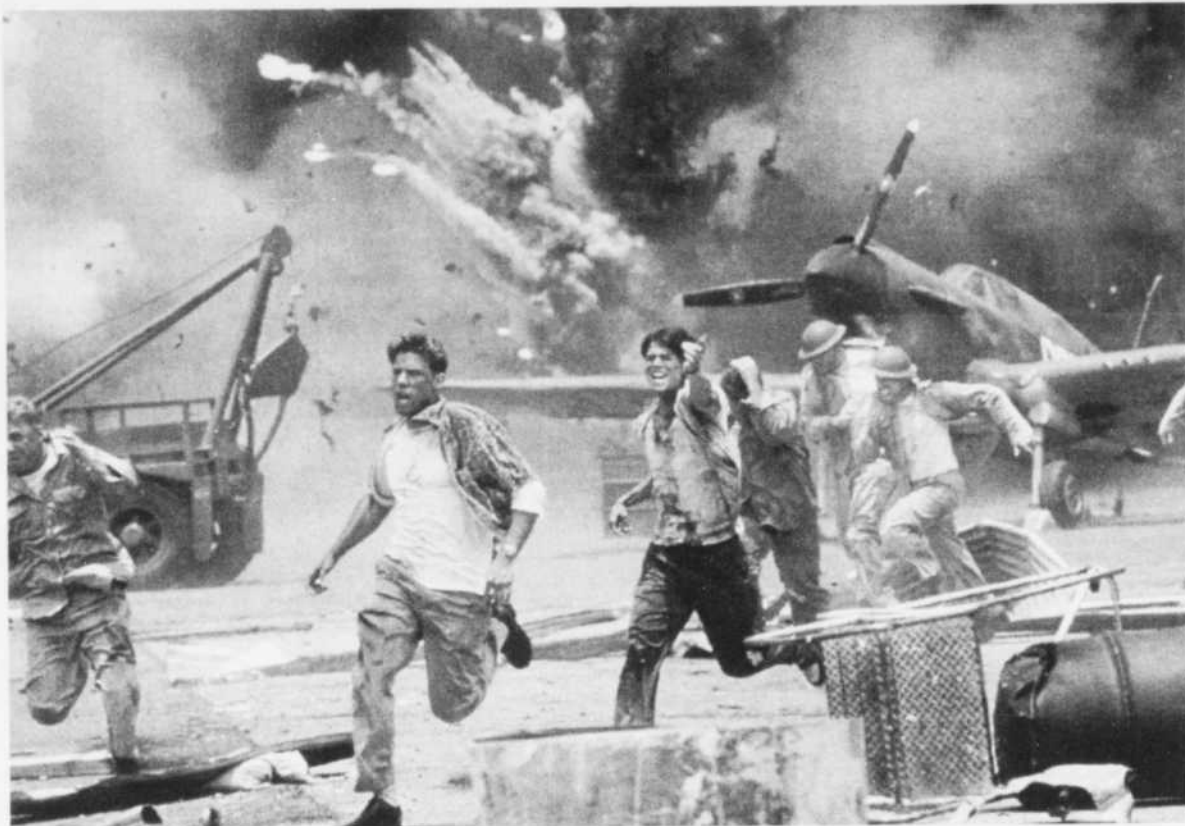
ACTION - «Pearl Harbor» de Michael Bay bénéficie des étonnants effets spéciaux du cinéma actuel. Le tout offre un bon film d'action.

où le navire «Antartica» coule tandis que les gens sur le pont tentent de s'accrocher et que d'autres demeurent prisonniers à l'intérieur.