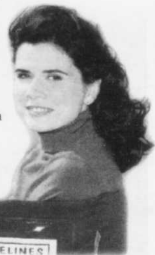
LES MUSES ORPHELINES

muses orphelines» se regarde avant tout comme une histoire d'enfants abandonnés, à la recherche de la vérité concernant un passé pas toujours agréable à évoquer.