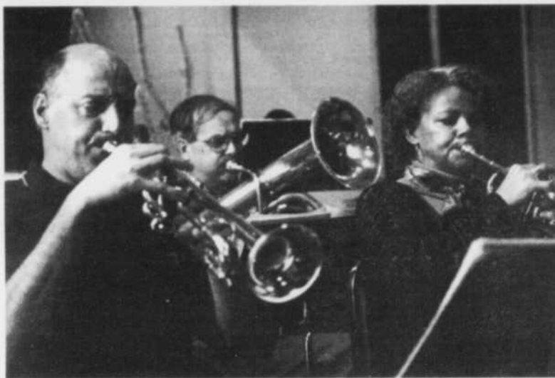
L'ORCHESTRE HARMONIQUE DE LA BAIE célèbre ses vingt ans. Pour la circonstance, il s'est allié à l'ensemble Au Mitan pour un concert alliant musique classique et populaire, ce soir à La Baie.

L'Orchestre Harmonique de La Baie célèbre cette année son 20e anniversaire de fondation. Le concert du 10 juin amorce la célébration de cet événement. Au printemps 2002, un grand rassemblement des anciens membres est prévu. Le concert aura lieu à l'église St-Édouard de Ville de La Baie, ce dimanche 10 juin à 19 h 30.