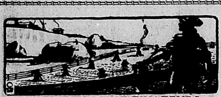
LA PAGE DES CULTIVATEURS