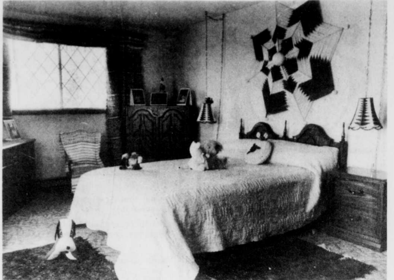
Le petit chien de peluche semble monter la garde à l'entrée d'une chambre où l'occupant se particularise par ses jouets et ses photos. Dans cet univers, la laine demeure le matériau privilégié.