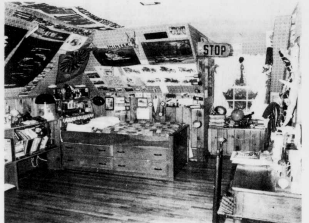
L'occupant de ces lieux ne craint guère de s'afficher. C'est le cas de le dire. Pour lui, chaque pouce de mur est autant d'invitation à y coller photos, posters, banderoles, etc... Dans l'ensemble, une chambre qui déroute mais qui vit.