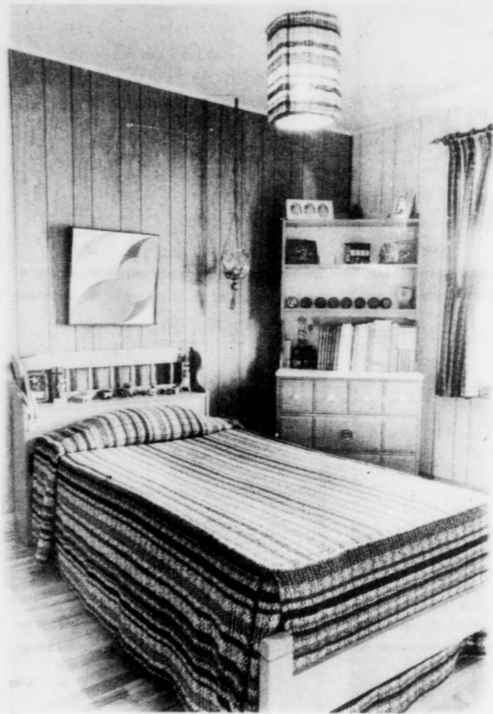
Une chambre où tout est ordonné, rangé...des livres aux jouets. La texture et le dessin de la lampe se marient avec les rideaux et le couvre-lit ce qui contribue à l'image projetée par cette chambre.

SHERBROOKE — Finies les armoires hors de portée, les pièces inutilement hautes et vastes, les recoins inutiles. La maison respecte beaucoup plus l'échelle humaine. Au prix où sont les matériaux, la main-d'oeuvre et l'énergie, on se fait plus pratique, plus raisonnable aussi.