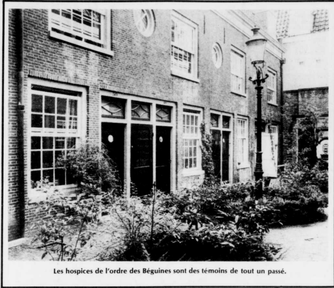
Les hospices de l'ordre des Béguines sont des témoins de tout un passé.

Des diverses constructions architecturales qui foisonnent dans toute la Hollande, les hospices ressortent parmi les plus intéressantes, spécialement pour les artistes et les amateurs de photo. Ce sont des trésors de cet ordre qui vous attendent en Hollande. Si vous aimez visiter l'intérieur des hospices, il suffit de passer au bureau VVV (Syndicat d'Initiative) de la ville, qui prendra les dispositions nécessaires. Ils seront enchantés de la faire -et vous-même, enchanté qu'ils l'aient fait.