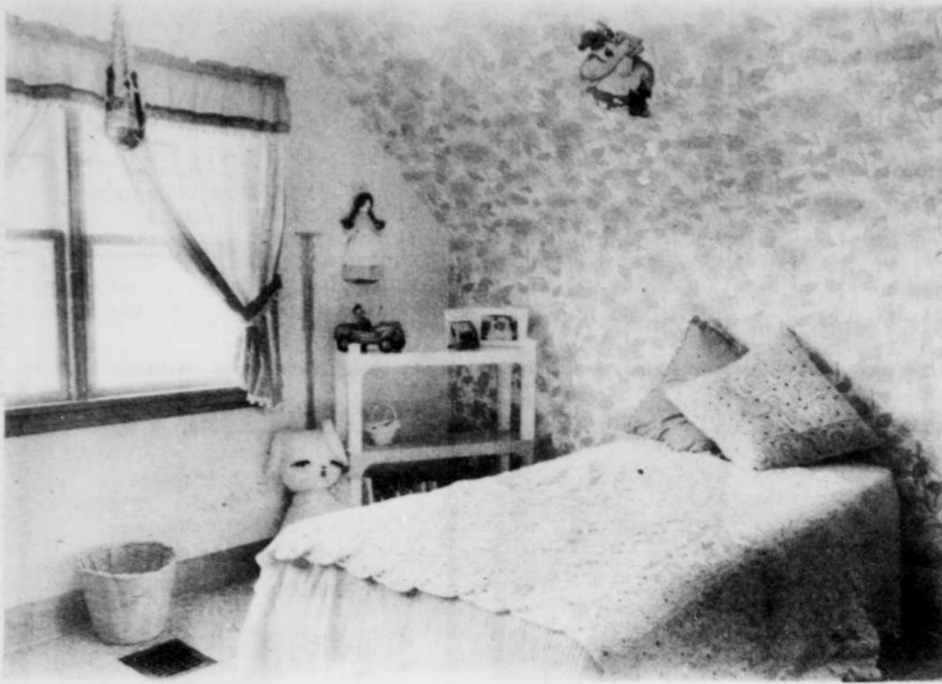
Une chambre toute féminine où le papier peint, le couvre-lit et la petite poupée accrochée au mur créent un univers calme et ordonné.