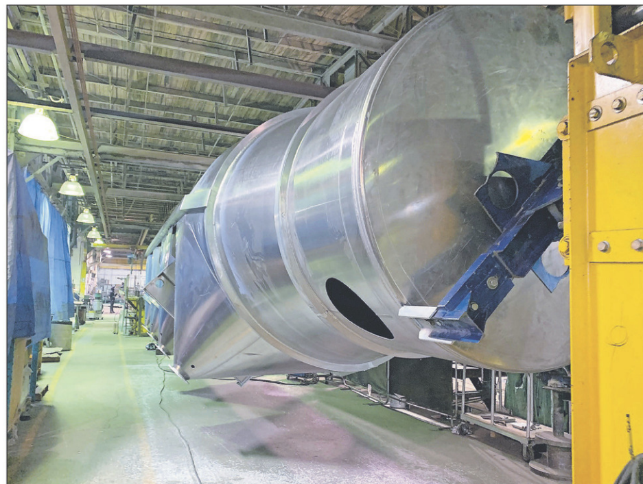
Tremcar ajoute à son offre la remorque-citerne Butler. Un produit plus robuste et haut de gamme.