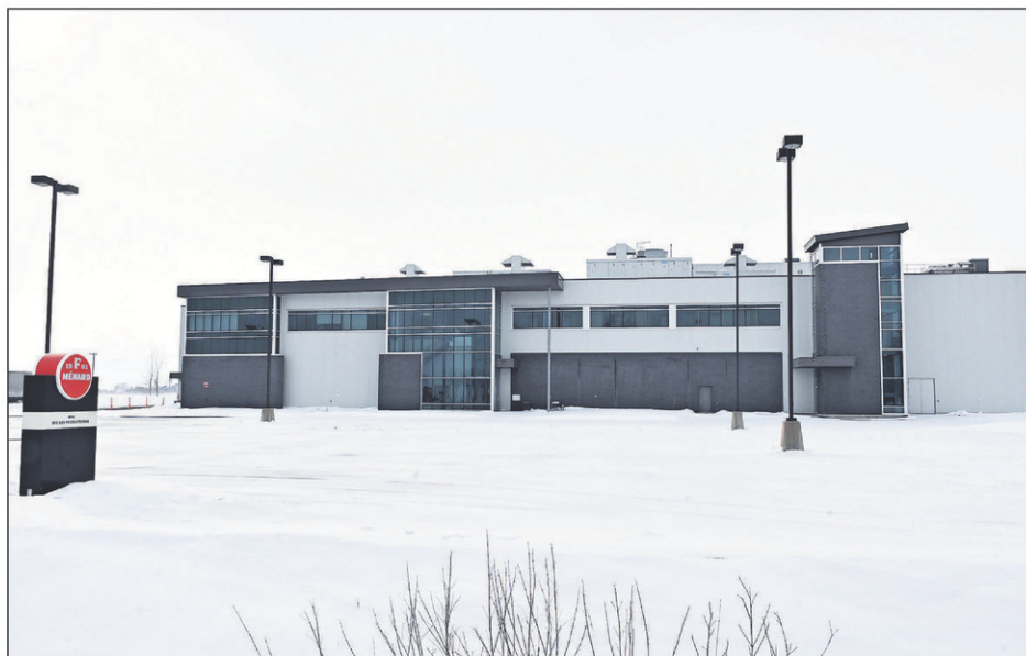
Olymel possède entre autres l'usine de surtransformation spécialisée dans la production de bacon à Henryville.